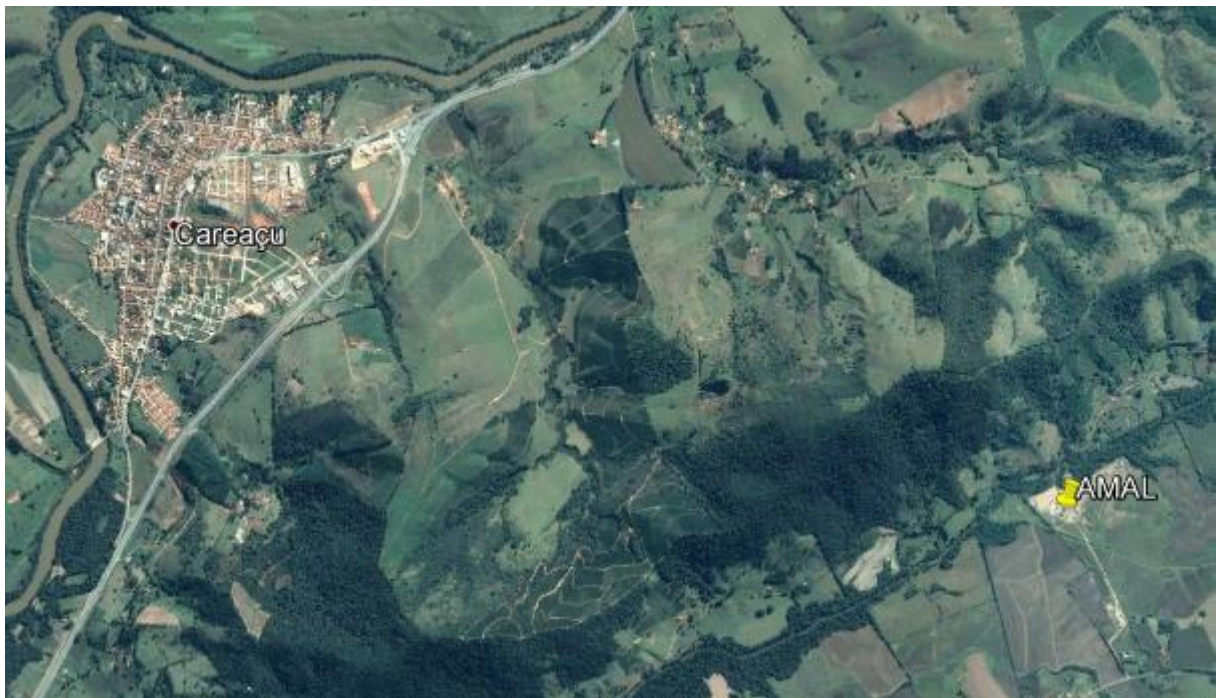
Figura 1.: Localização do empreendimento AMAL.

O empreendimento possui sede no Sítio Alvorada, constituída por escritório com banheiro, galpão para guarda de maquinários e manutenções e ponto de abastecimento com tanque aéreo de 2.000L com bacia de contenção. Conta com 6 funcionários com horário de trabalho de 07:00 às 17:00, de segunda-feira a sexta-feira. Dentre os equipamentos utilizados destacam-se 1 carregadeira, 2 caminhões, 1 escavadeira hidráulica, 1 balsa e 1 hidrociclone.