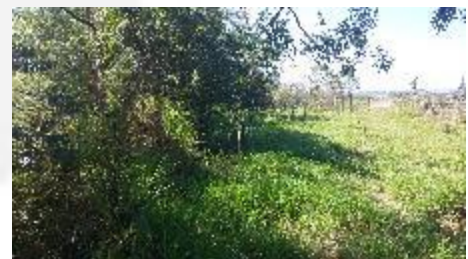
Foto 08. APP em recuperação.