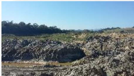
Foto 03. Deposição de material para recuperação da cava aluvionar.