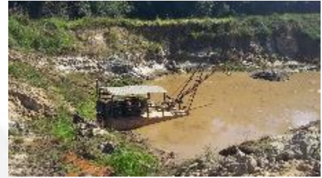
Foto 02. Cava aluvionar.