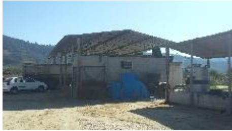
Foto 01. Galpão de manutenção e ponto de abastecimento.