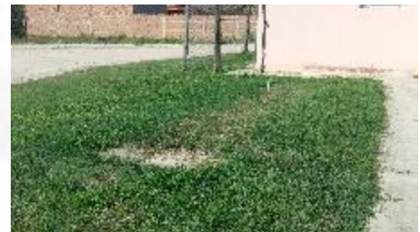
Foto 06. Fossa séptica.