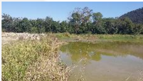
Foto 05. Tanque de decantação.