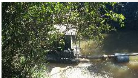
Foto 07. Dragagem em curso d'água.