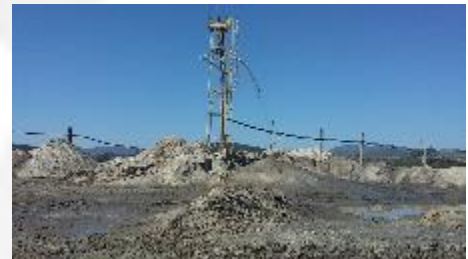
Foto 04. Classificação dos produtos.