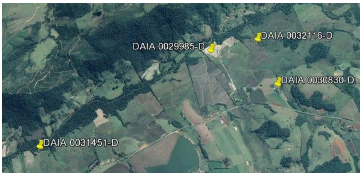
Figura 3.: Pontos autorizados nos DAIA emitidos para o empreendimento.