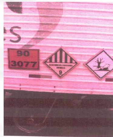
Foto 02. Vista lateral do caminhão