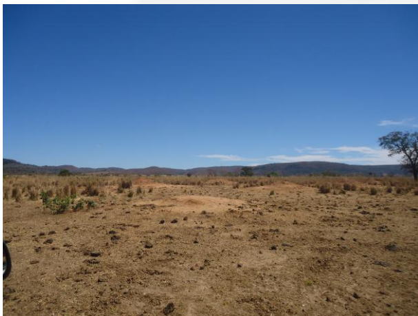
Foto 01. Área destinada à implantação da UFV

Empreendedor: SOLATIO SERVIÇOS ADMINISTRATIVOS LTDA Empreendimento: SUNNY SERVIÇOS ADMINISTRATIVOS LTDA CNPJ: 13.852.135/0001-27 Municípios: ITACARAMBI Atividade(s): SUBESTAÇÃO DE ENERGIA ELETRICA/USINA SOLAR FOTOVOLTAICA Código(s) DN 74/04: E-02-04-6 E E-02-06-2 Processo: 15057/2013/001/2013 Validade: 04 anos