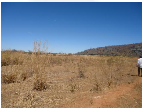
Foto 03. Área destinada à implantação da UFV