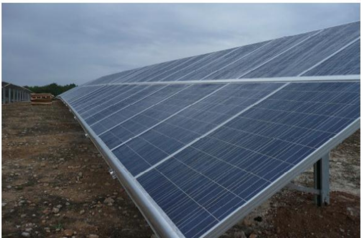
Figura painéis Solares.

Painel solar: é o componente encarregado da recepção e transformação da radiação proveniente do Sol, em energia elétrica. A configuração espacial do Parque Solar de Itacarambi - MG serão utilizados como unidade de produção arranjos modulares de 22 painéis, produzindo uma potência nominal de 5,28 Kwp que deverão se ligar ao Quadro de Distribuição. O arranjo, deverá se dar em módulos quadrados de 1000 Kwp, onde deverão ser dispostas 222 unidades (strings) de 22 painéis ligadas a um quadro de distribuição, com carregadores de 3,00 metros entre as linhas dos painéis. Cada arranjo dos módulos deverá prover 1 Mw , para onde toda a energia solar captada será encaminhada a um transformador/inversor, O parque de geração solar possuirá uma potência instalada da ordem de 30 Mw, com produtividade aproximada de 1700 MWh/ Mw, prognosticado portanto, uma produtividade da planta de 51.000 MWh ano de energia injetada na rede.