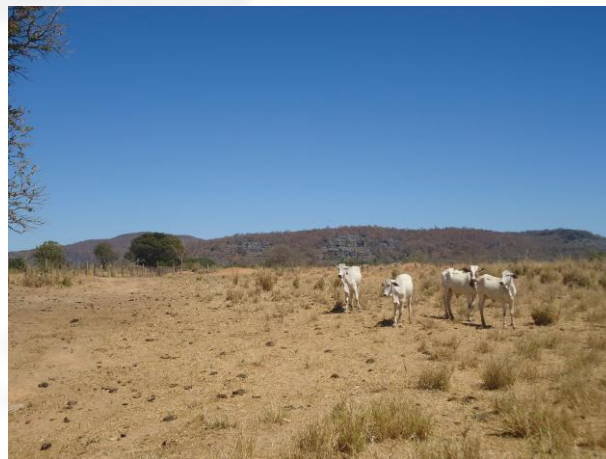
Foto 02. Área destinada à implantação da UFV