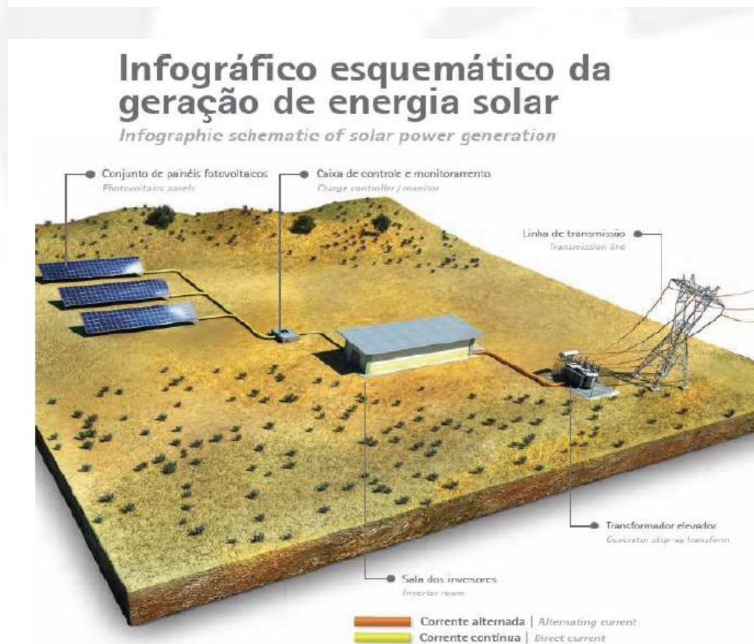
Figura esquema da geração de energia solar.