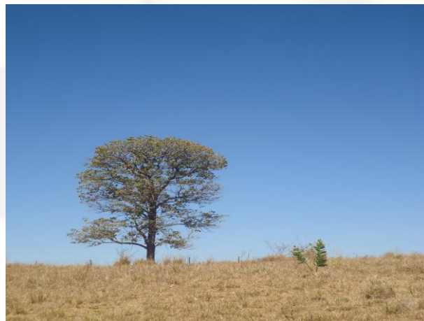
Foto 04. Indivíduos arbóreos isolados localizados na área destinada implantação da UFV.