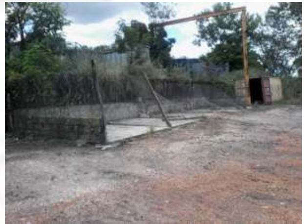
Foto 06. Área atual de disposição de materiais