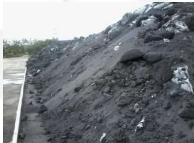
Foto 04. Local atual de estocagem do material dos BigBags.