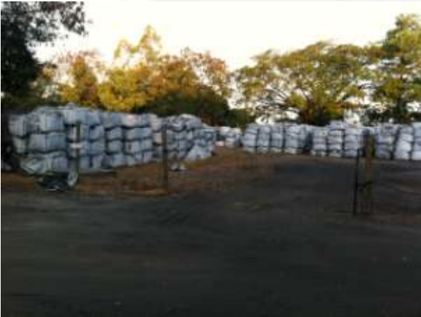
Foto 01. Antiga área de Estocagem Bigbags

Empreendedor: Rotavi Industrial LTDA Empreendimento: Rotavi Industrial LTDA CNPJ: 708.097.779-0089 Município: Várzea da Palma Atividade: Produção de Ligas Metálicas Código DN 74/04: B-04-01-4 Processo: 0021/1980/023/2014 Validade: 04 anos Validade: 04 anos