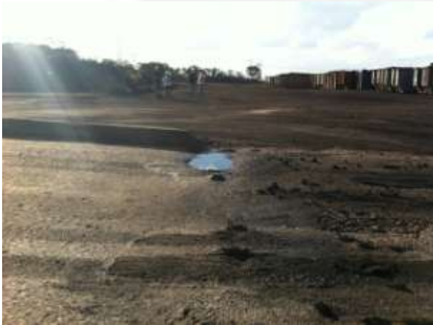
Foto 09. Antiga área de disposição de materiais

Empreendedor: Rotavi Industrial LTDA Empreendimento: Rotavi Industrial LTDA CNPJ: 708.097.779-0089 Município: Várzea da Palma Atividade: Produção de Ligas Metálicas Código DN 74/04: B-04-01-4 Processo: 0021/1980/023/2014 Validade: 04 anos Validade: 04 anos