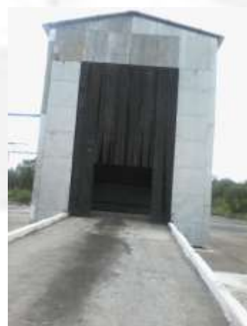
Foto 08. Segundo Sistema de Descarga de Carvão .