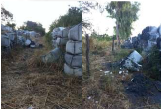
Foto 11. Área antes utilizada para estoque de bigbags