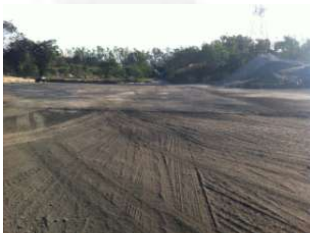
Foto 07. Área antes da Instalação do Sistema de Descarga de Carvão