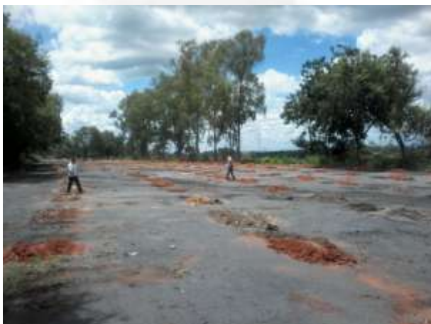
Foto 03. Recuperação da área dos BibBags com plantio de espécies nativas