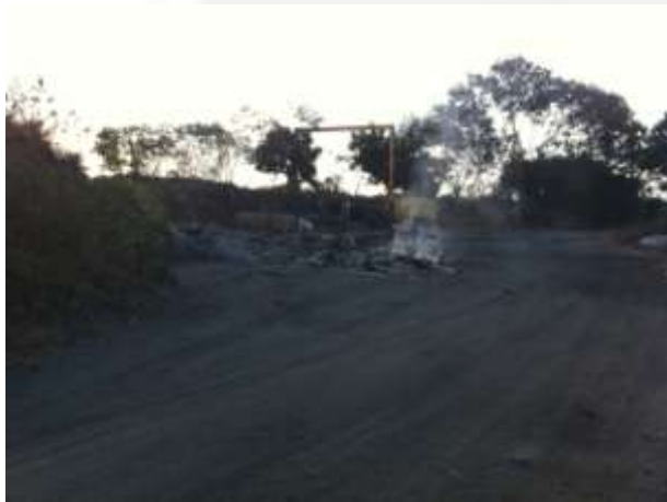
Foto 05. Antiga área de disposição de materiais

Empreendedor: Rotavi Industrial LTDA Empreendimento: Rotavi Industrial LTDA CNPJ: 708.097.779-0089 Município: Várzea da Palma Atividade: Produção de Ligas Metálicas Código DN 74/04: B-04-01-4 Processo: 0021/1980/023/2014 Validade: 04 anos Validade: 04 anos