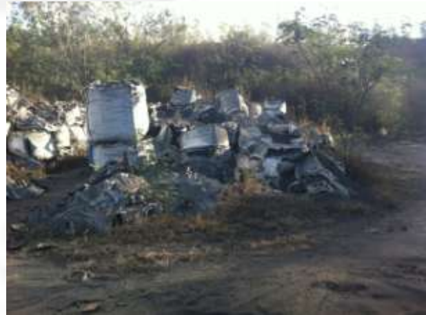
Foto 02. Antiga área de Estocagem Bigbags