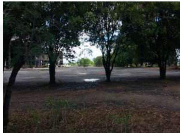
Foto 12. Área atual.