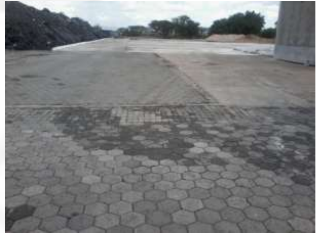
Foto 10. Área atual de disposição de materiais