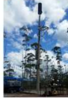
Praça Vargem Grande