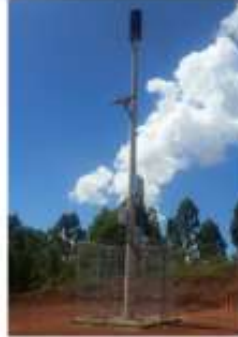
Praça Maravilhas II