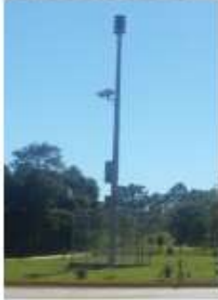
Praça BR 356