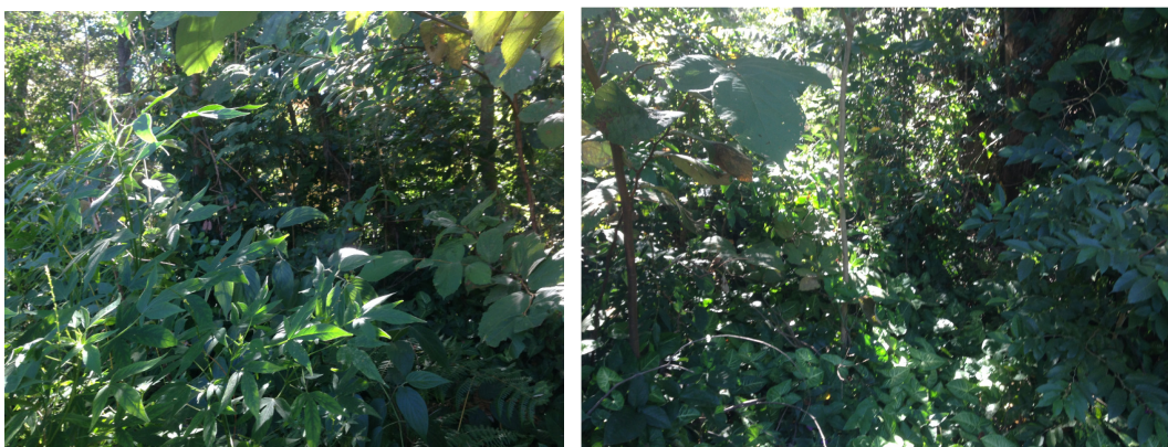
Figura 03 e 04 - Área de Compensação.

A área onde ocorrerá a compensação florestal será na própria propriedade, sendo assim, as características ambientais são aquelas informadas na caracterização da área de intervenção. O referido fragmento se apresenta de forma mais adensada do que a área requerida para intervenção, conforme Fotos 3 e 4.