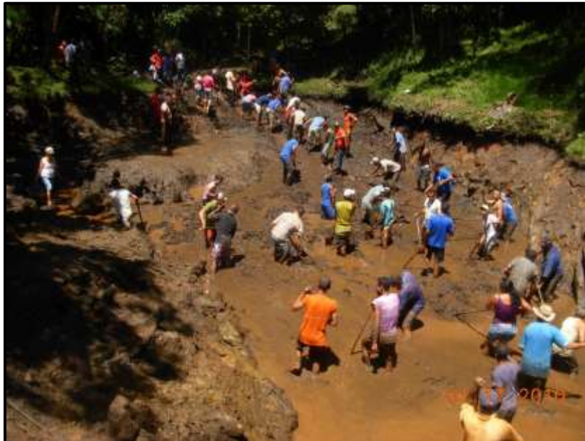
Foto do mutirão

http://bangalodeflores.blogspot.com/2010/03/movimento-dos-sem-agua.html#more