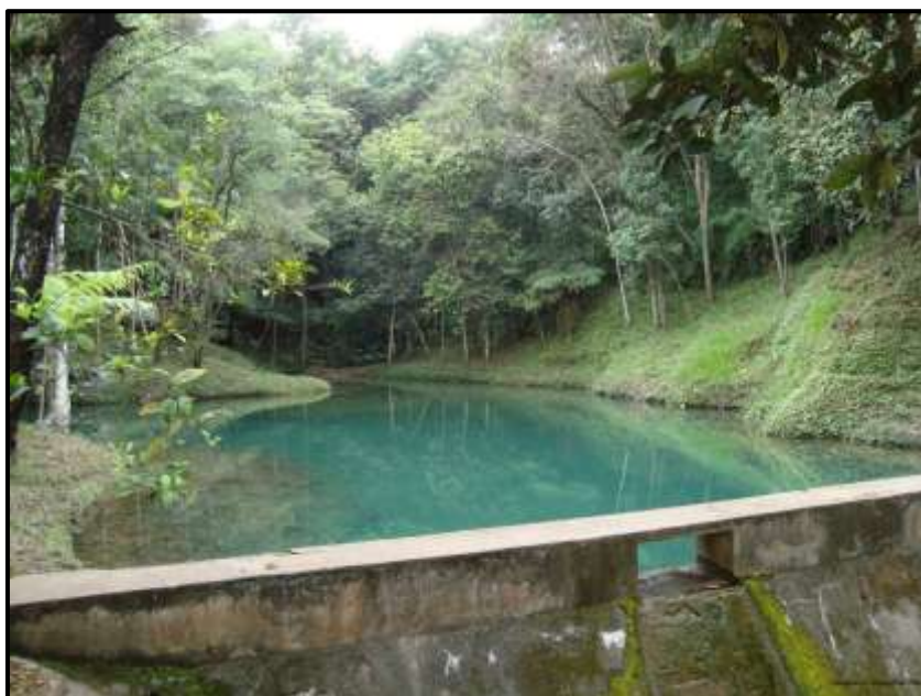
Foto do manancial antes

Realizaram um mutirão de limpeza no manancial João Batista, na comunidade do Pires, que foi poluído devido a deslizamentos de terras com a construção de uma estrada da empresa Namisa, muito próxima à mina da Ferro + Mineração S.A. , tendo ocasionado a falta de água potável por diversas ocasiões para os moradores. Também realizaram ações junto aos órgãos públicos, já que a Prefeitura de Congonhas e a Copasa não tomavam providências.