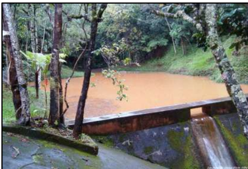
Foto do manancial depois