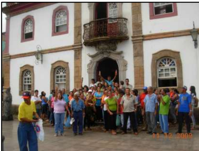
Foto de mobilização da comunidade em Congonhas

http://bangalodeflores.blogspot.com/2010/03/movimento-dos-sem-agua.html#more