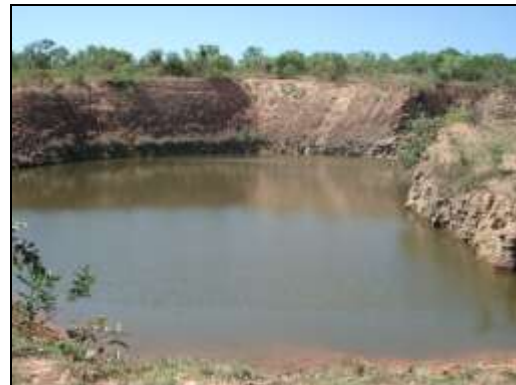
Foto 02: Outra frente de lavra da Lavrar Mineração com água.