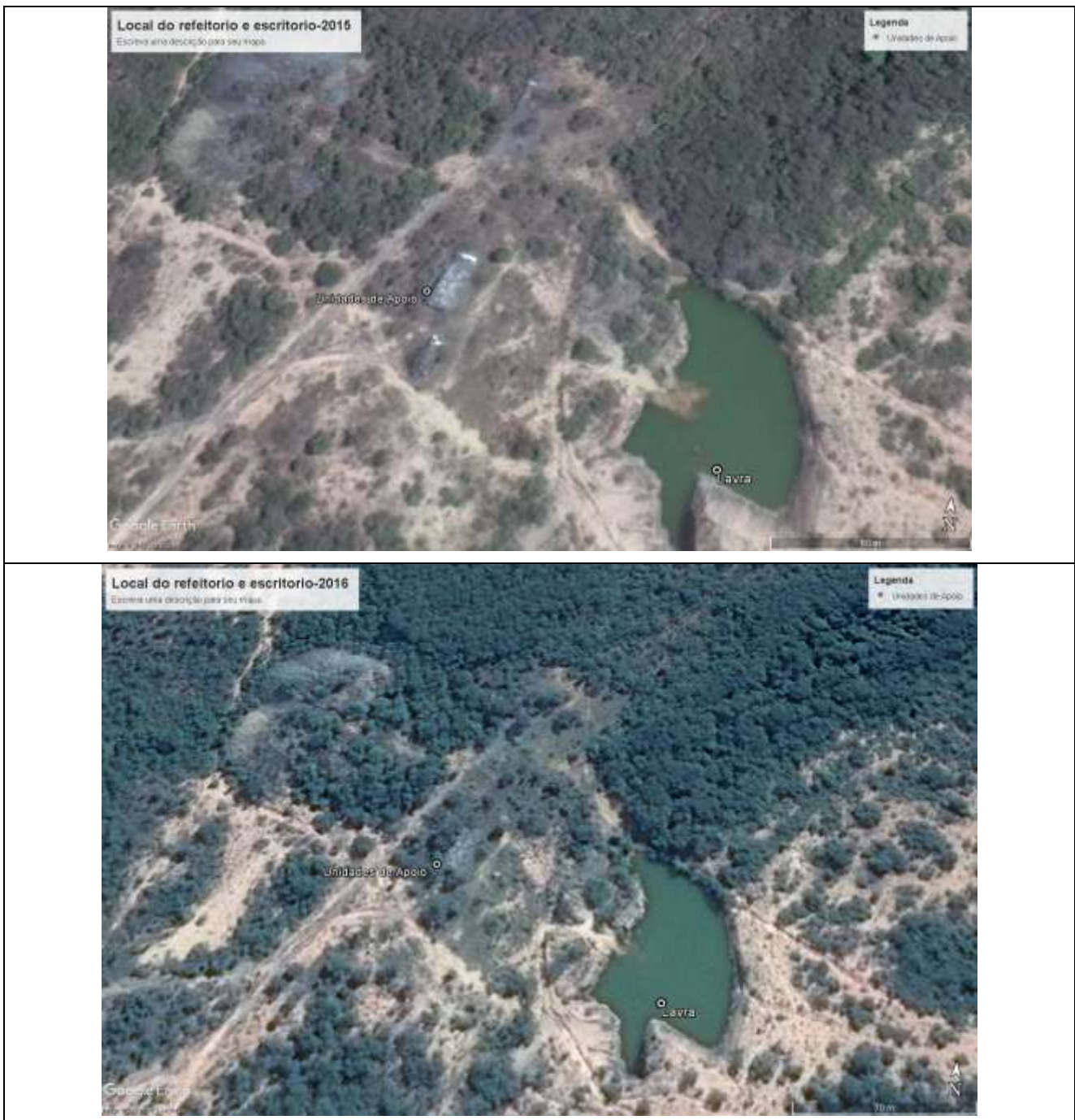
Imagem 02: A área em destaque apresenta o local onde seriam implantados o refeitório e as unidades de apoio do empreendimento. É possível se observar que as estruturas não foram implantadas e o crescimento da vegetação natural na ADA.

Para ratificar o entendimento da SUPRAM Central, o próprio empreendedor declara na formalização da LO que “ necessita adquirir sua Licença de Operação (LO) para ficar devidamente qualificada com objetivo futuro de viabilizar a mina... ”.