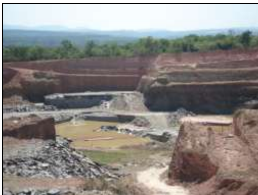
Foto 01: Frente de lavra da Lavrar Mineração.

A área do empreendimento é de 25,00 hectares, distribuída em duas frentes de lavra. A produção prevista era de 500m 3 /mês de lajão e 250m 3 /mês de lajinha, proporcionando uma produção anual de 9.060m 3 com vida útil estimada em 177 anos. A principal frente de lavra possui as seguintes dimensões: 12 metros de altura, 100 metros de comprimento e 40 metros de largura (Ilustração 2). A outra frente de lavra encontra-se encoberta por depósito de água de origem pluvial (Ilustração 3).