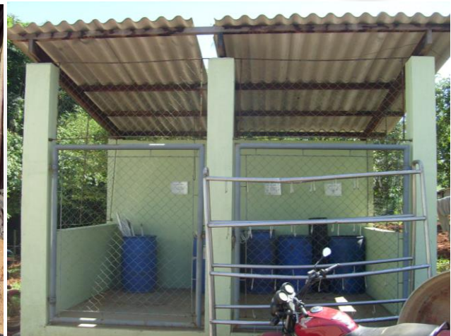
Separação de resíduos sólidos