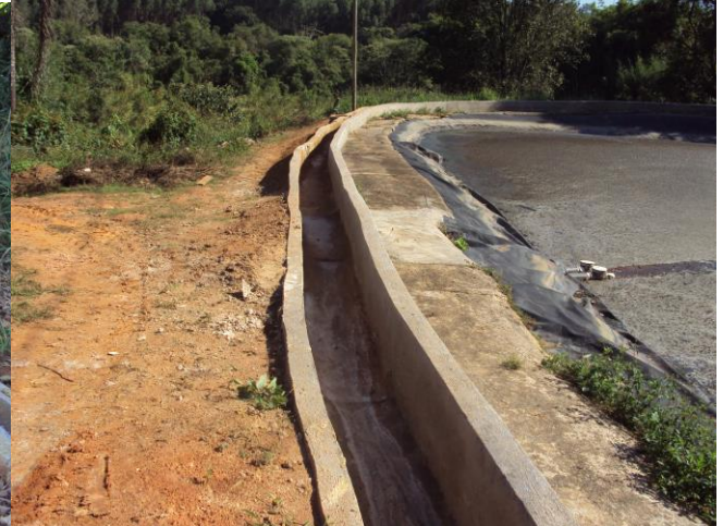
Drenagem pluvial no entorno das lagoas