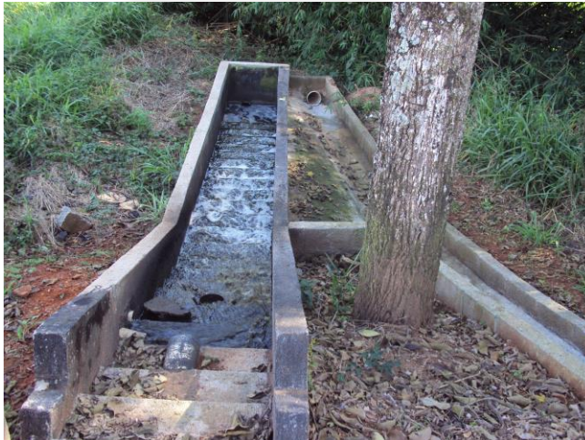
Lançamento do efluente com escada de aeração