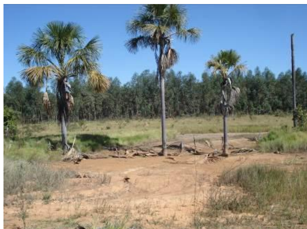
Figura 01: Comprometimento da drenagem superficial à esquerda e degradação de áreas de veredas à direita. Constatação em vistoria do órgão ambiental no ano de 2010.

Destaca-se ainda a presença de 7 (sete) barramentos na propriedade que por si só se configuram como uma interferência direta na drenagem superficial, uma vez que a alteração da vazão, por exemplo, pode comprometer a perenidade de corpos d'água a jusante.