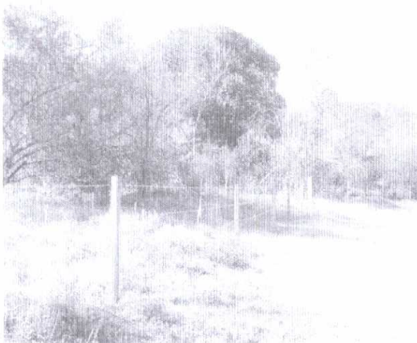
Fotografia 02: Vista parcial da área revegetada (à esquerda) onde se observa cerca de isolamento e mudas plantadas, à direita, estrada de acesso.