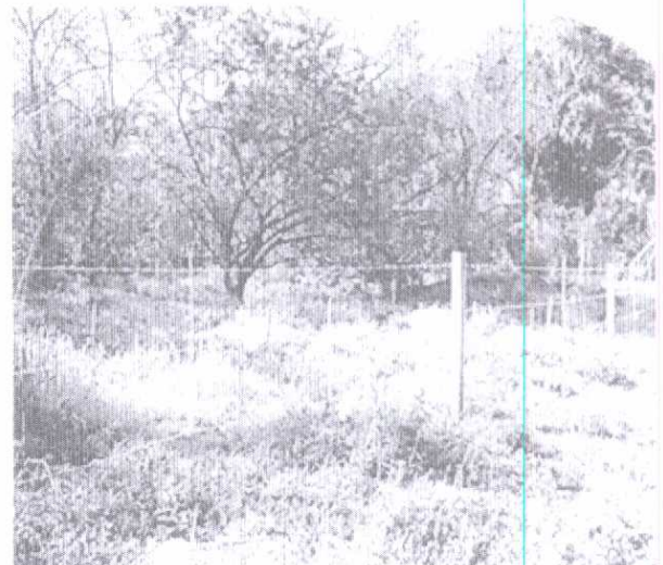
Fotografia 03: Vista parcial da área revegetada onde se observa, em primeiro plano, cerca de isolamento e mudas plantadas e estaqueadas, ao fundo, mata ciliar do Ribeirão Santa Barbara.