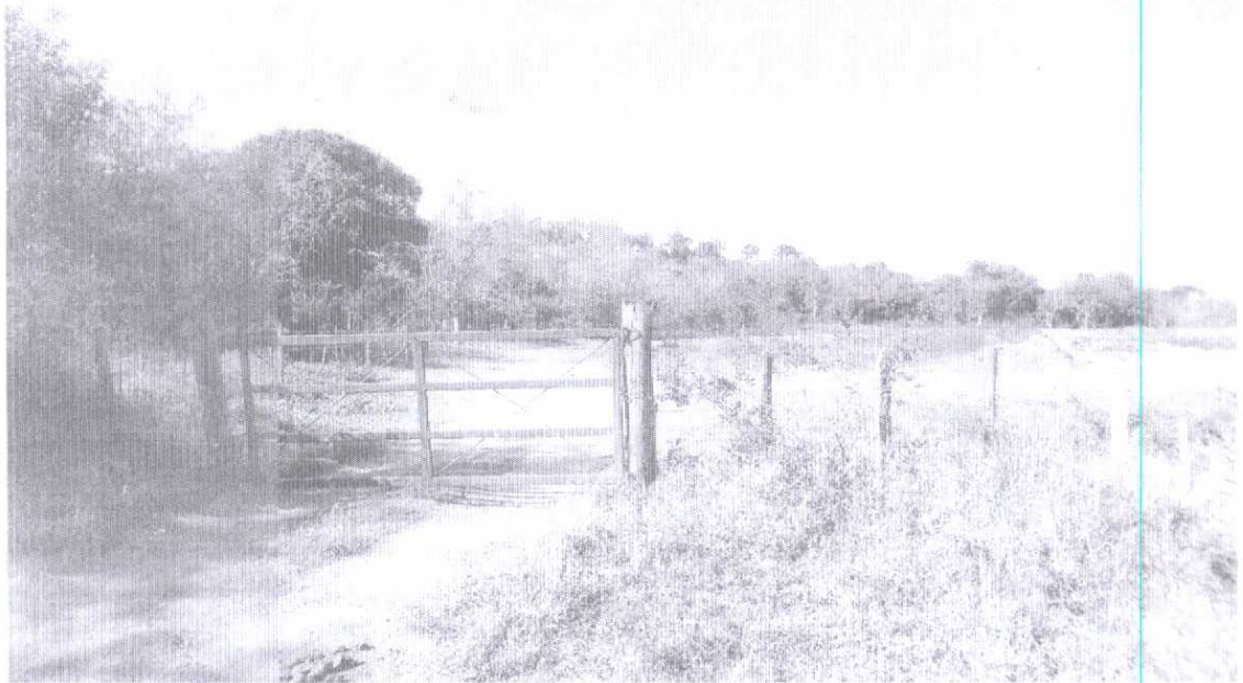
Fotografia 01: Vista parcial da propriedade onde se observa, em primeiro plano, a entrada da mesma isolada por cerca, à direita em segundo plano, antiga cava de extração de minérios e ao fundo, área revegetada na APP do Ribeirão Santa Barbara.