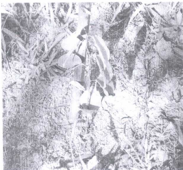
Fotografia 04: Vista em detalhe de muda plantada, estaqueada e coroada.