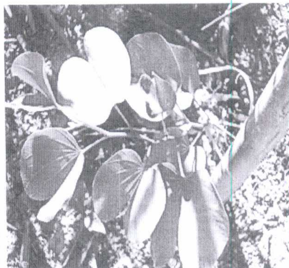
Fotografia 05: Vista em detalhe de muda plantada, estaqueada e coroada.