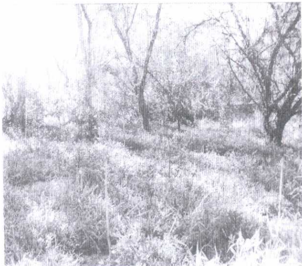
Fotografia 04: Vista parcial da área revegetada onde se observa, em primeiro plano, mudas plantadas e estaqueadas e, ao fundo mata ciliar em regeneração na APP.