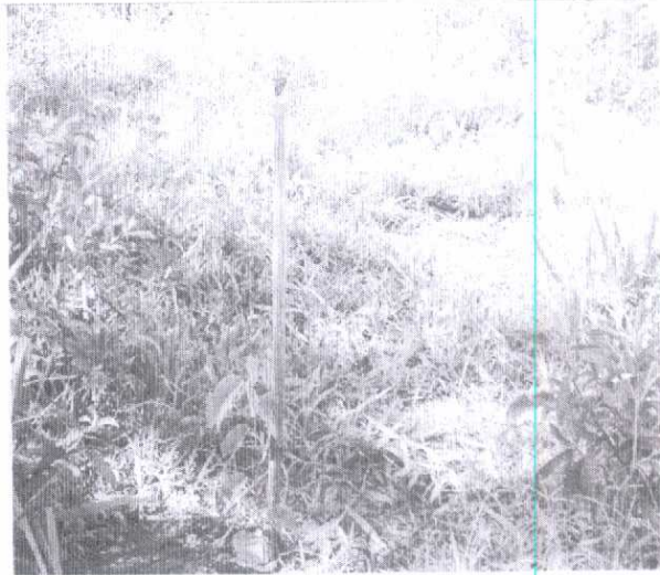
Fotografia 05: Vista parcial da área revegetada onde se observa, mudas plantadas e estaqueadas com cobertura de gramíneas junto ao solo.