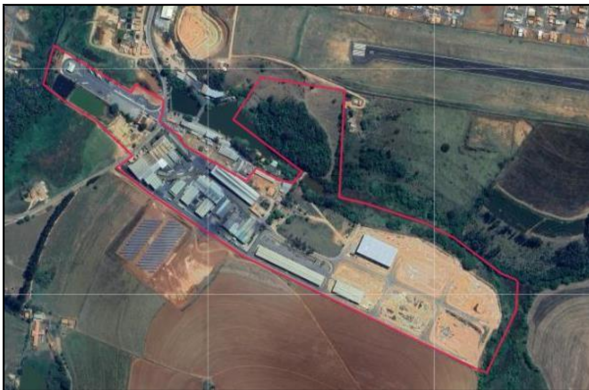
Imagem 02 - Localização do empreendimento JF Pasqua

A capacidade nominal instalada do empreendimento para a atividade principal do empreendimento que é a produção de fundidos de metais não ferrosos - código B-04-05-7 é de 580 toneladas/dia.