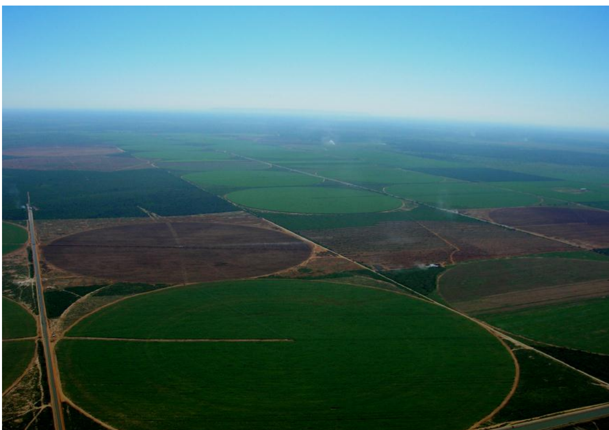
Figura 1 - Irrigação, Fazenda Serra Azul (Jaíba/MG).

O projeto agrícola completo da Fazenda Serra Azul prevê um canavial com 18 pivôs centrais numa área de 2.019,32 hectares, representação 48% da ocupação total (figura 01).