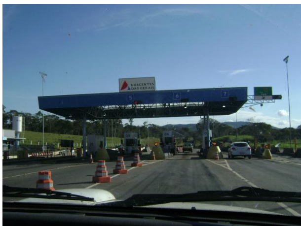
Foto 01. Praça de pedágio.

Empreendedor: Concessionária Rodovia MG 050 S/A. Empreendimento: Concessionária Rodovia MG 050 S/A. CNPJ: 08.822.767/0001-08 Município: Diversos Atividades: Pavimentação e/ou melhoramentos de rodovias Códigos DN 74/04: E-01-03-1 Processo: 12082/2005/003/2012