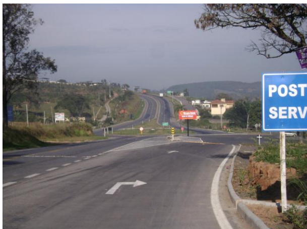
Foto 5. Vista de um trecho da rodovia com sinalização vertical e horizontal.

Empreendedor: Concessionária Rodovia MG 050 S/A. Empreendimento: Concessionária Rodovia MG 050 S/A. CNPJ: 08.822.767/0001-08 Município: Diversos Atividades: Pavimentação e/ou melhoramentos de rodovias Códigos DN 74/04: E-01-03-1 Processo: 12082/2005/003/2012