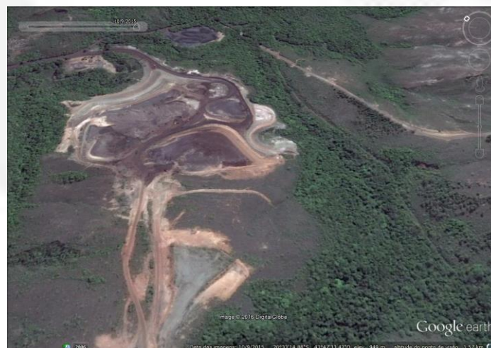
Figura 2: Pilha de Estéril de 18,9 hectares que foi implantada no empreendimento.

A pilha de produtos possui área final de 18,9 ha. Tratava-se de área constituída por cobertura vegetal representada por campo cerrado com elevado grau de antropização, além de áreas degradadas exemplificadas pelas voçorocas, já estabilizadas, que após todo tratamento necessário (drenagem de fundo, estudos geotécnicos) passou a estocar os produtos provenientes das UTM's. O material depositado nesta pilha é composto principalmente por produtos na granulometria arenosa (fração Sinter Feed - 74%), já desaguados. O percentual restante (26%) é composto por produtos finos, granulometria pellet feed. A taxa de geração destes produtos fora de especificação é de cerca de 475.000 t/ano.