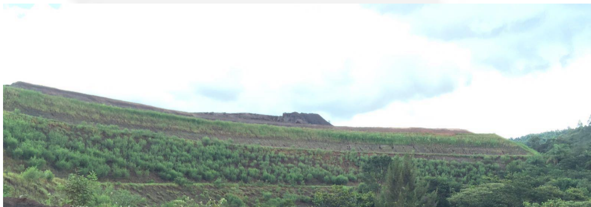
Figura 3: Pilha de Estéril do empreendimento

Em relação à condicionante nº 3, é apresentado abaixo foto de parte da pilha de estéril que utilizou a serapilheira depositada pelo empreendimento.