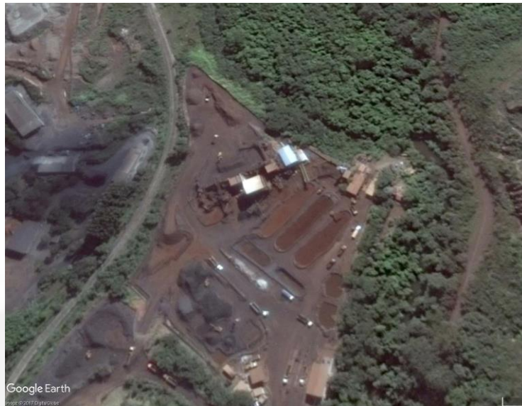
Figura 1: Vista Geral do empreendimento. Destaca-se as 3 baias de decantação implantadas em superfície.

A pilha de produtos possui área final de 18,9 ha. Tratava-se de área constituída por cobertura vegetal representada por campo cerrado com elevado grau de antropização, além de áreas degradadas exemplificadas pelas voçorocas, já estabilizadas, que após todo tratamento necessário (drenagem de fundo, estudos geotécnicos) passou a estocar os produtos provenientes das UTM's. O material depositado nesta pilha é composto principalmente por produtos na granulometria arenosa (fração Sinter Feed - 74%), já desaguados. O percentual restante (26%) é composto por produtos finos, granulometria pellet feed. A taxa de geração destes produtos fora de especificação é de cerca de 475.000 t/ano.