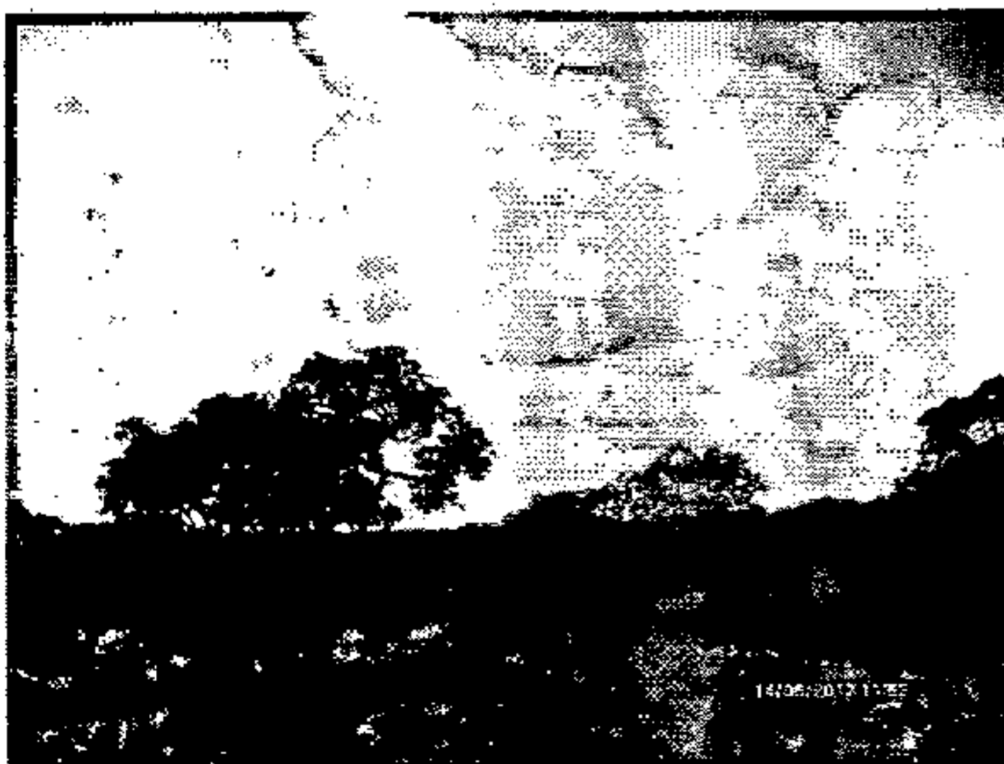
Foto 03. Reserva legal