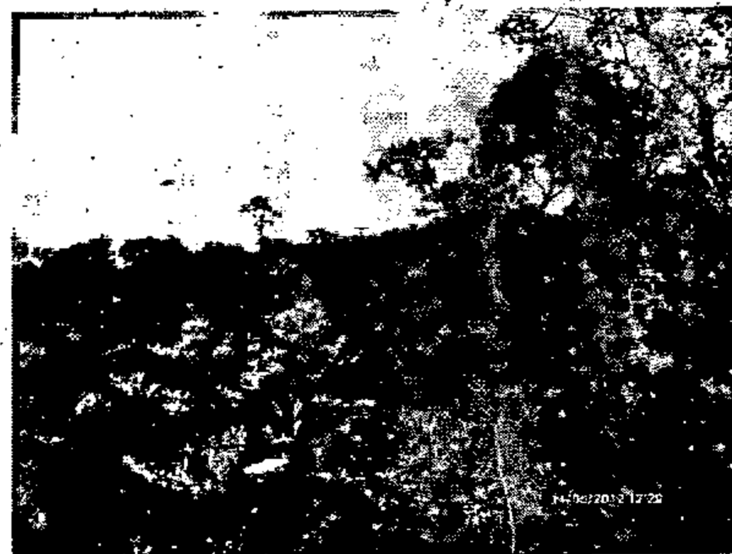
Foto 04. Reserva legal