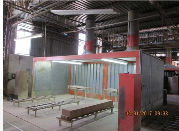
Foto 06. Cabine de pintura a seco