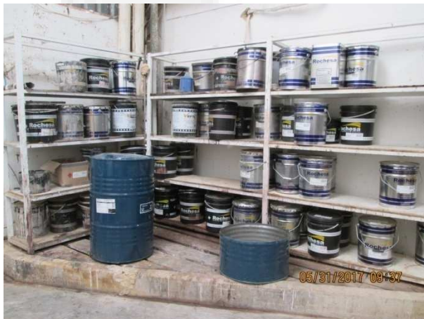
Foto 03. Produtos químicos no setor produtivo