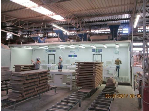
Foto 05. Cabine de lixação madeira tratada