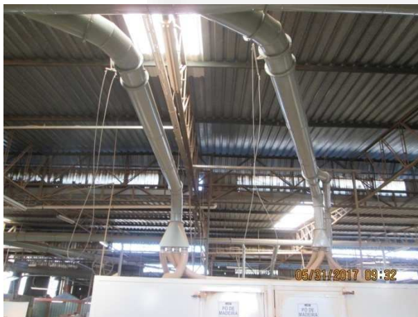
Foto 09. Sistema de exaustores para o pó de madeira