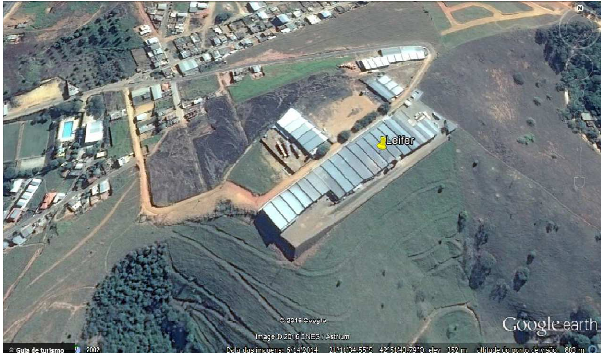
Localização do empreendimento

Em relação ao Meio Socioeconômico, a empresa tem contribuição relevante, uma vez que oferta dezenas de postos de trabalho diretos e indiretos.