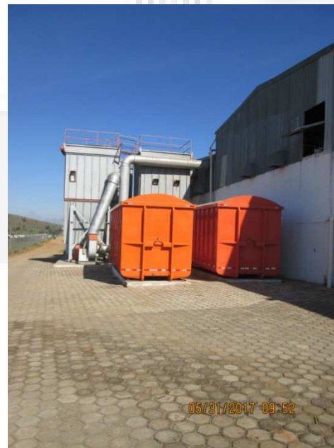
Foto 10. Armazenamento do pó de madeira