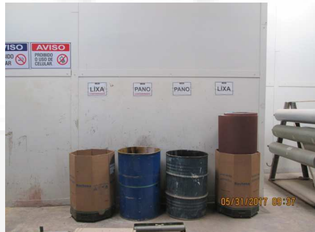
Foto 04. Lixeiras para coleta seletiva