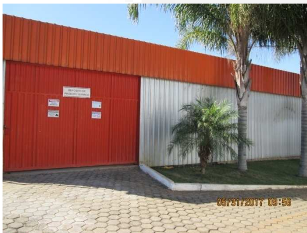
Foto 01. Área de armazenamento de produtos químicos

Empreendedor: Leifil Móveis LTDA Empreendimento: Leifil Móveis LTDA CNPJ: 05.690.271/0001-30 Município: Rodeiro/MG Atividade: Fabricação de móveis de madeira, vime e junco ou com predominância destes materiais, com pintura e/ou verniz Código DN 74/04: B-10-02-2 Processo: 10745/2005/006/2016 Validade: 10 anos