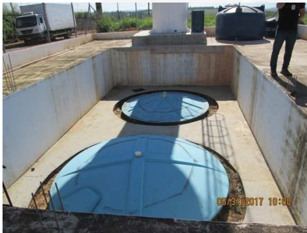
Foto 07. Sistema fossa séptica/filtro anaeróbio nº 01