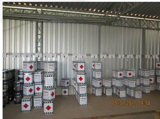
Foto 02. Interior do estoque de produtos químicos