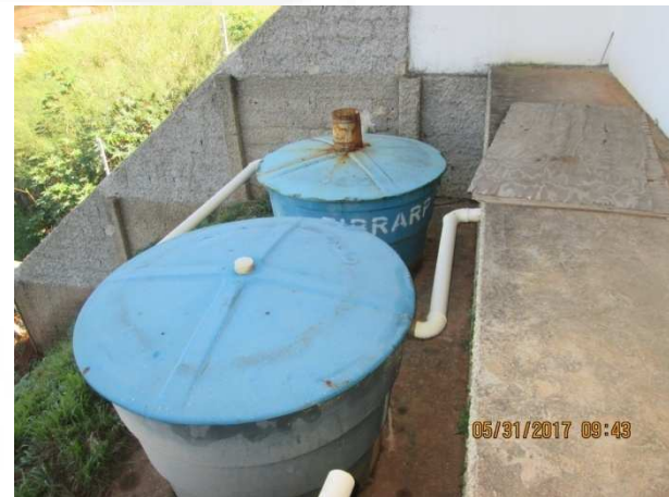
Foto 08. Sistema fossa séptica/filtro anaeróbio nº 02