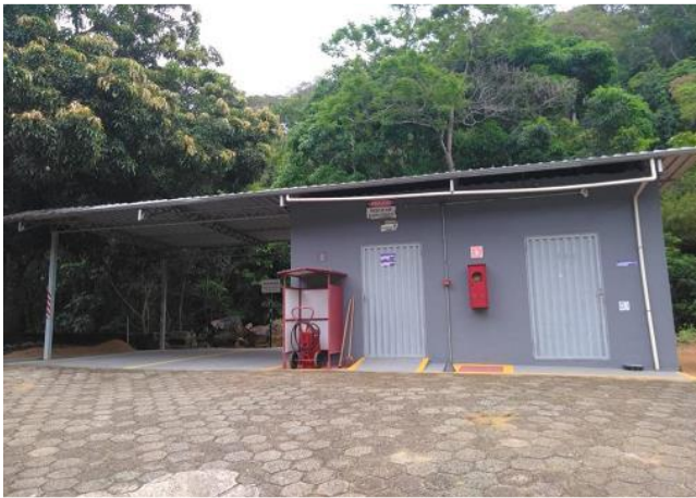
Foto 8: Depósito de Resíduos Perigosos localizado na CGH Miguel Pereira (mesmo empreendedor).