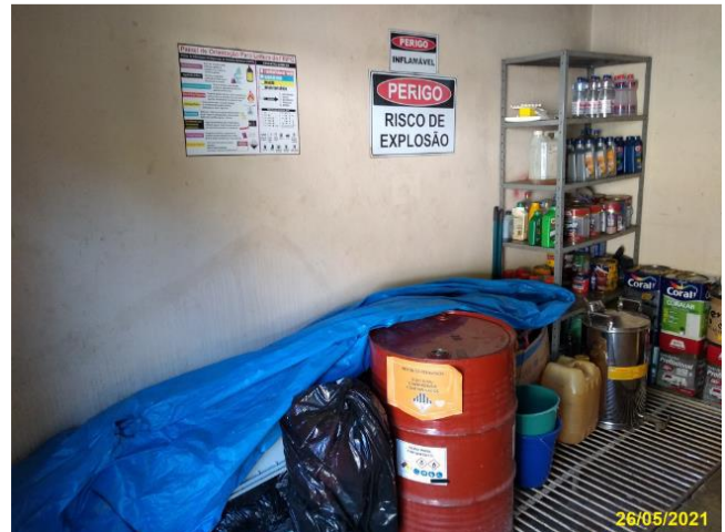
Foto 9: Vista do interior do Depósito de Resíduos Perigosos.