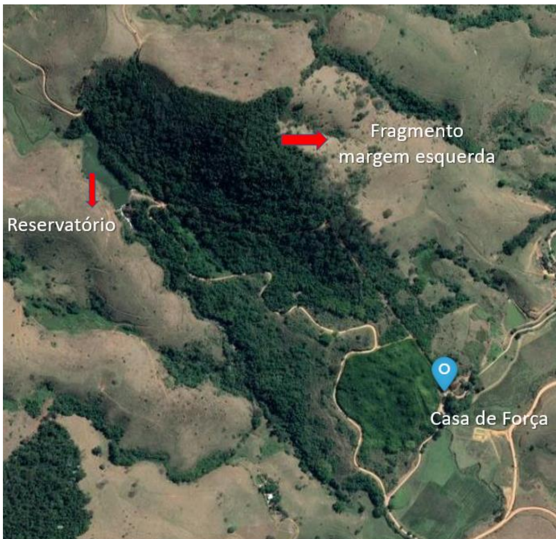
Figura 3: Aspecto da cobertura vegetal na área da CGH Santa Cecília.

Cumprir informar que na atual fase de licenciamento não está prevista a supressão de vegetação, uma vez que o empreendimento já está completamente instalado e em operação desde a década de 1950.