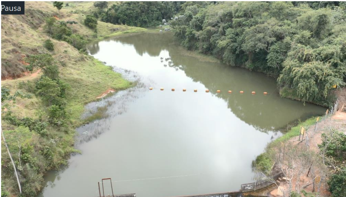
Foto 2: Visualização do reservatório da CGH Santa Cecília, foto datada de 26/05/21.