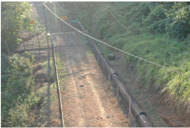
Foto 4: Trecho do canal de adução.