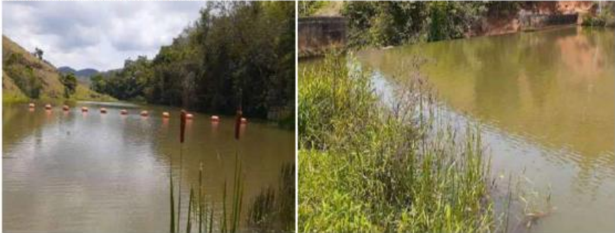
Figura 4: Ponto de amostragem P01 – Coleta realizada em ambiente lêntico.

Coordenada: 23K 748801.08 m E 7660319.42 m S