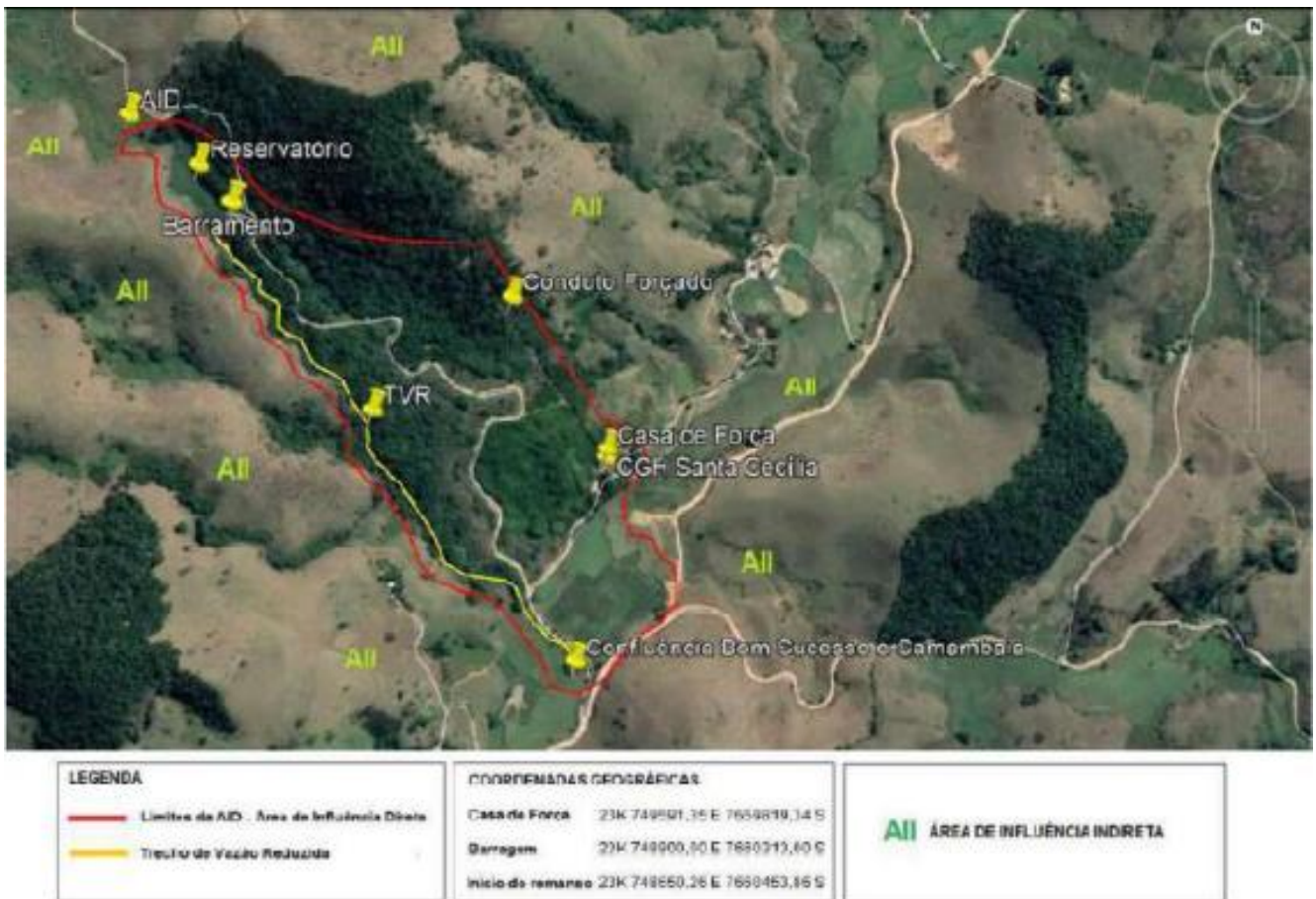
Figura 2: Limites da AID e AII da CGH Santa Cecília.

Para o Meio Socioeconômico a AID foi delimitada a partir das propriedades rurais localizadas numa extensão de 30 metros da cota de inundação (reservatório e restituição), incluindo também as áreas de preservação permanente (conforme estabelecido no Art. 62 da Lei nº 12.651 de 25 de maio de 2012).