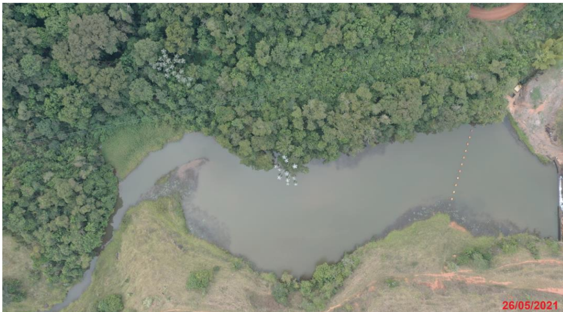
Foto 1: Vista do reservatório da CGH Santa Cecília, margem direita (do empreendedor) com cobertura florestal e margem esquerda (de terceiros) com áreas de pastagem.