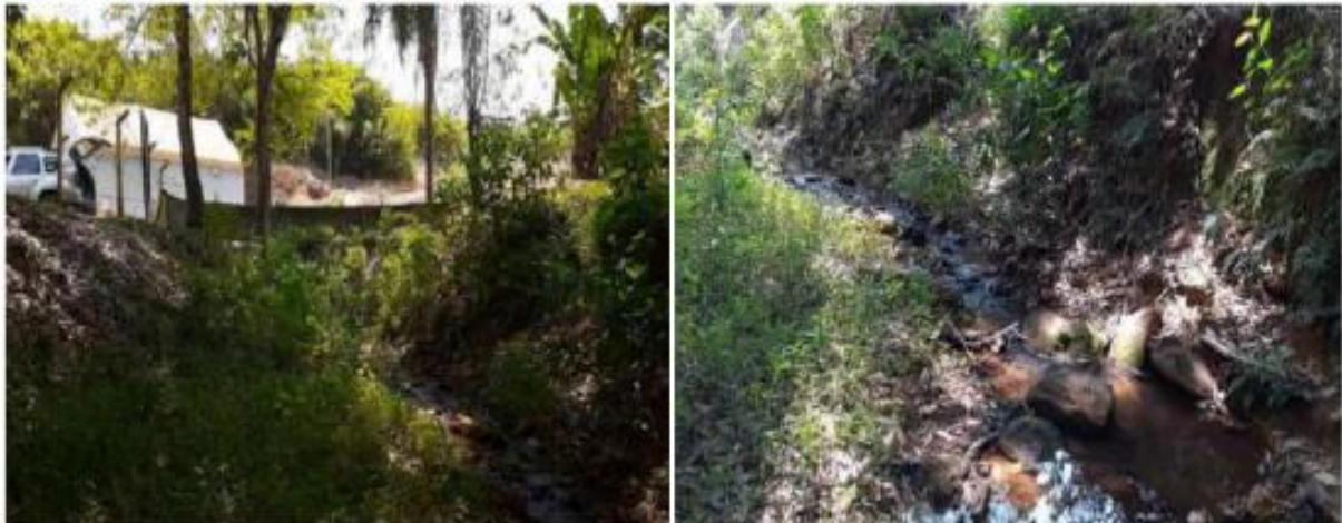
Figura 5: Saída da água turbinada da CGH Santa Cecília/local de amostragem.

Coordenada: 23 K 749598.58 m E 7659797.03 m S