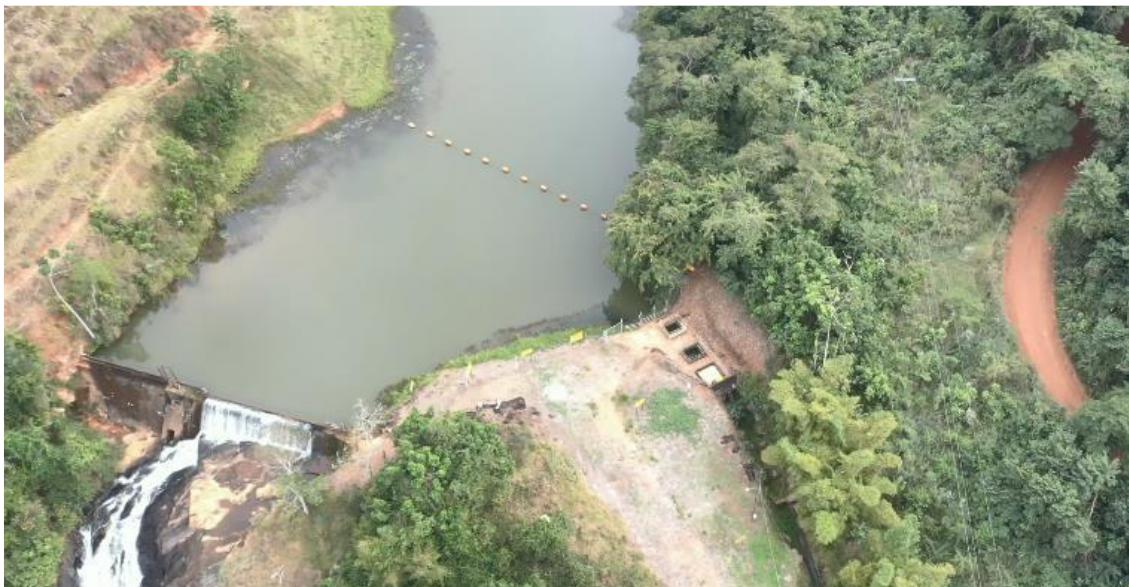
Foto 3: Barragem e tomada d'água da CGH Santa Cecília.