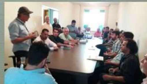
São Joaquim de Bicas/MG