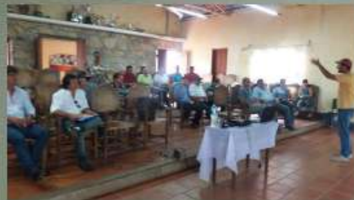
Piedade dos Gerais/MG