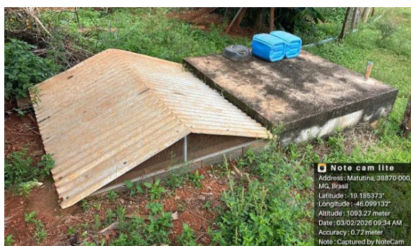
Foto 04. Vista - Reserva Legal