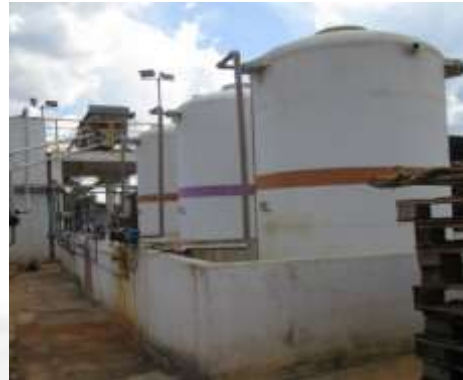
Figura 02: Tanques de produtos químicos