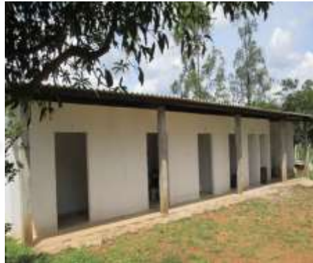
Figura 09: Depósito temporário de resíduos

A empresa realiza o programa de gerenciamento dos resíduos e deverá continuar realizando este, conforme descrito no item 2 do anexo II deste Parecer Único.