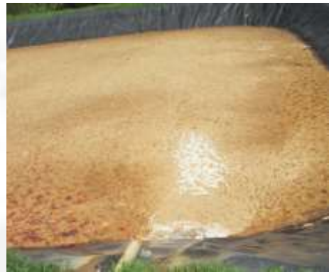
Figura 06: Tanque de equalização