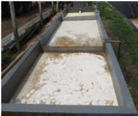
Figura 05: Caixa de separação de gordura

A ETEI é composta por sistema de tratamento físico-químico e biológico; e possui as seguintes estruturas e equipamentos: caixa de gordura, um tanque de equalização, flotador, dois reatores biológicos em série, um decantador secundário com raspador mecanizado e um tanque de acúmulo de gordura. Após o tratamento o efluente é lançado em curso d'água.