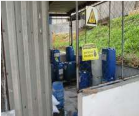
Figura 01: Depósito de produtos químicos