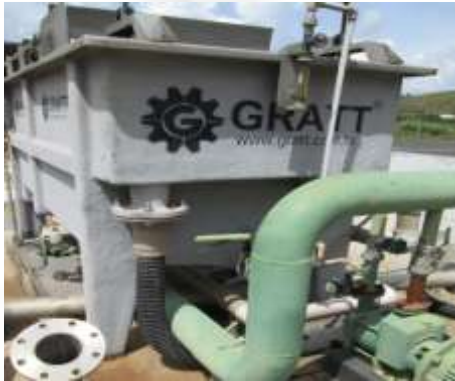
Figura 07: Flotador