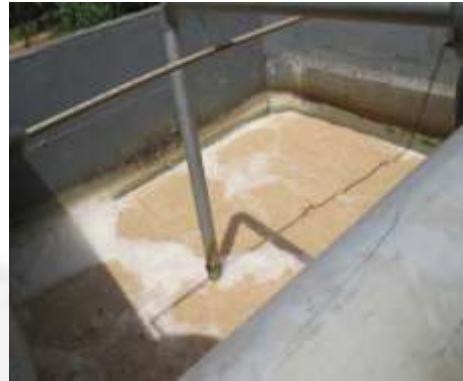
Figura 08: Reator biológico aerado

O empreendimento já realiza análise dos efluentes líquidos e os resultados das análises demonstram que os parâmetros analisados estão dentro dos padrões de lançamentos estipulados na DN conjunta COPAM/CERH Nº 01/2008.