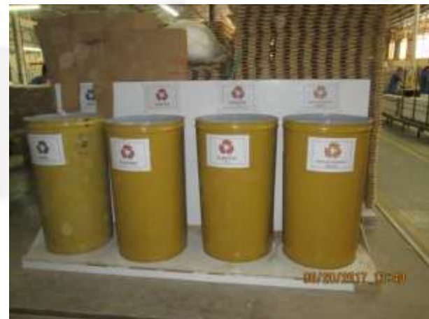
Figura 04: Lixeiras para coleta seletiva no setor produtivo