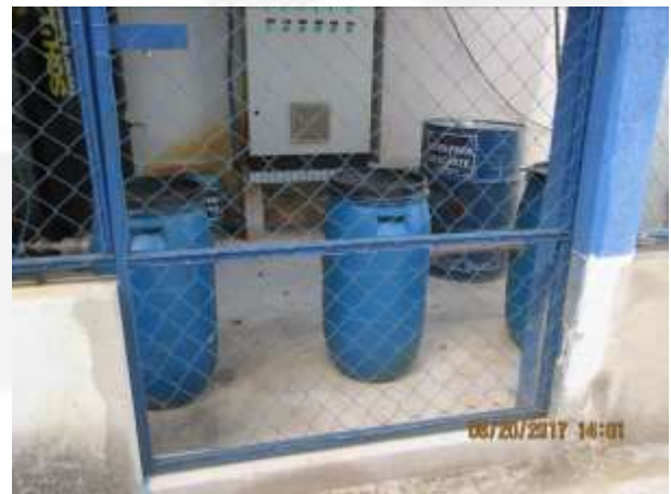
Figura 09: Bombonas com função SAO