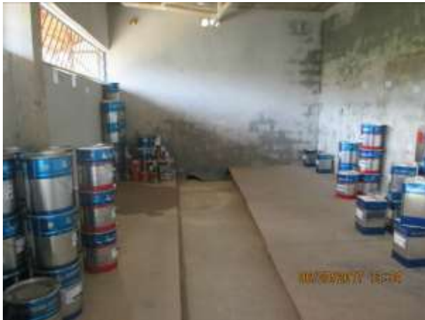
Figura 05: Interior depósito produto químico