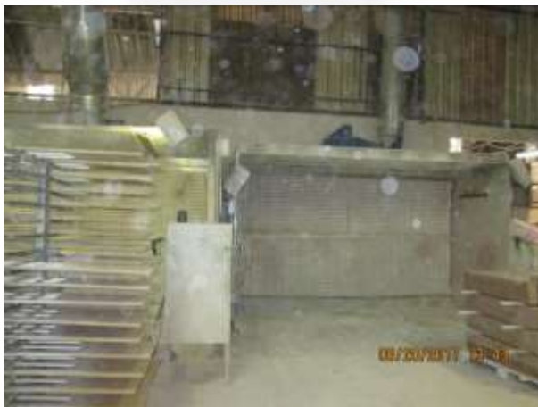
Figura 03: Cabine de pintura a seco