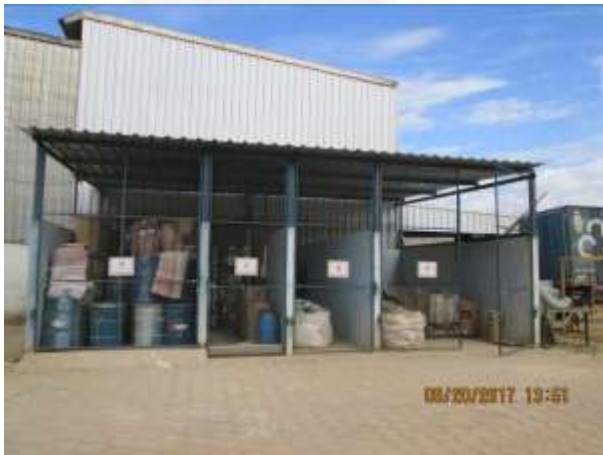
Figura 01: Depósito Temporário de Resíduos