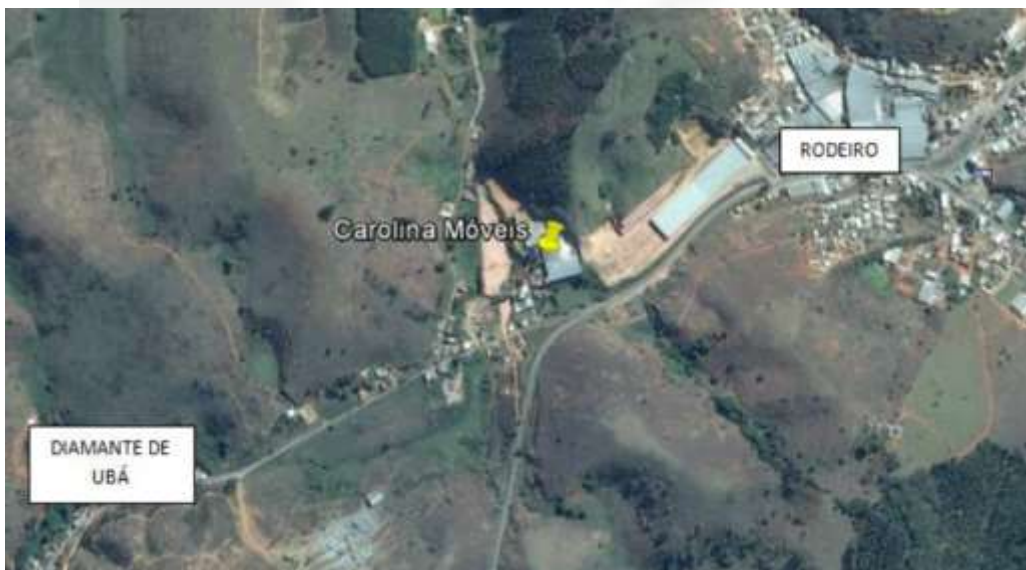
Localização do empreendimento

A atividade desenvolvida é fabricação de móveis de madeira, vime e junco ou com predominância destes materiais, com pintura e/ou verniz (B-10-02-2). Ocupa uma área de 9.000 m 2 e possui 230 funcionários (podendo chegar a 240 em épocas de maior produção), sendo 50 na área administrativa e 190 na área de produção. O enquadramento pela DN COPAM 74/2004 levando em consideração a área construída e o número de funcionários é Classe 05 (cinco). Não há nenhuma estrutura em área de preservação permanente (APP).