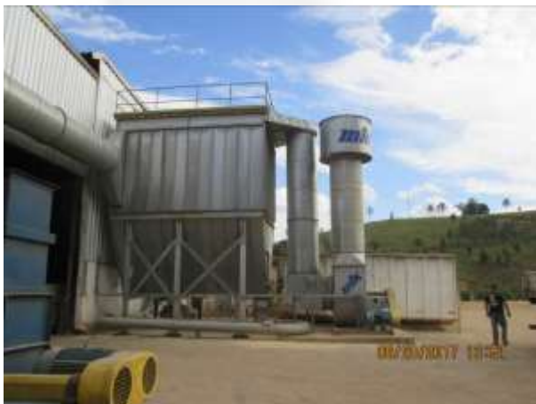
Figura 08: Sistema de containeres para o pó de madeira