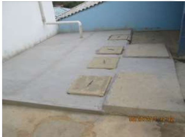
Figura 02: ETE sanitária