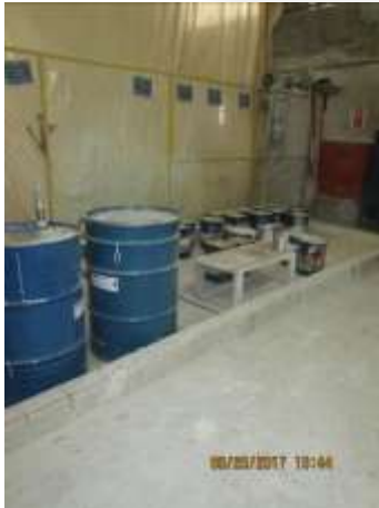
Figura 06: Produtos químicos – linha de produção