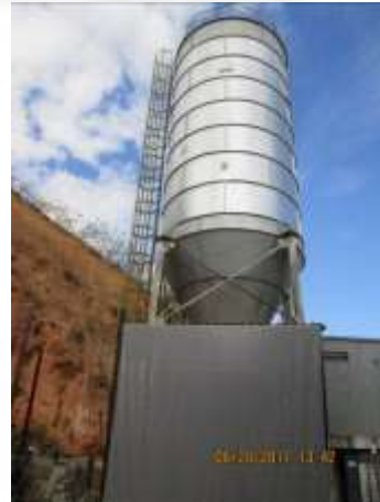
Figura 07: Silos para o pó de madeira