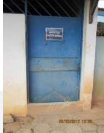
Figura 06: Exterior depósito produto químico