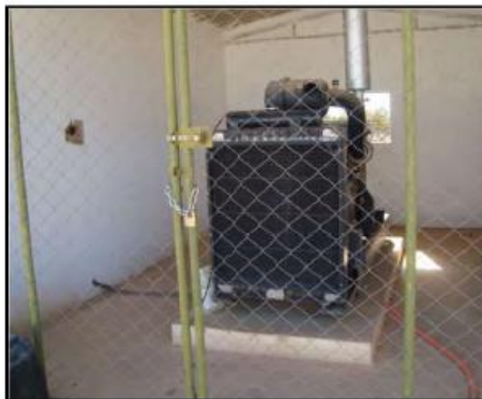
Foto 03. Gerador a diesel (utilizado em caso de falta de energia).