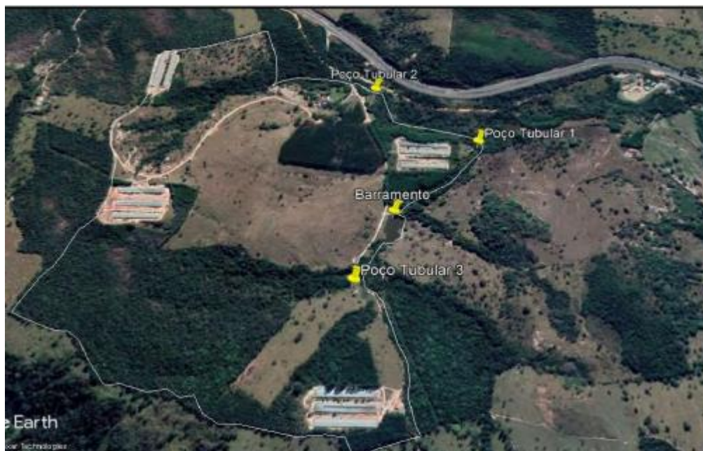
Figura 03. Área do empreendimento e localização dos poços tubulares.