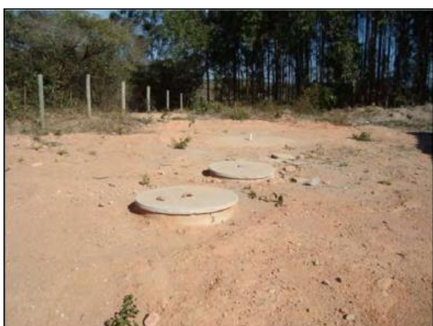
Foto 05. Estação de tratamento de efluentes sanitários