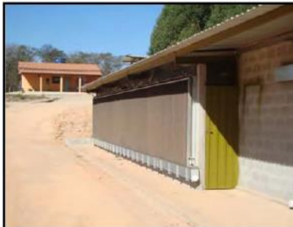
Foto 01. -Lateral do galpão--