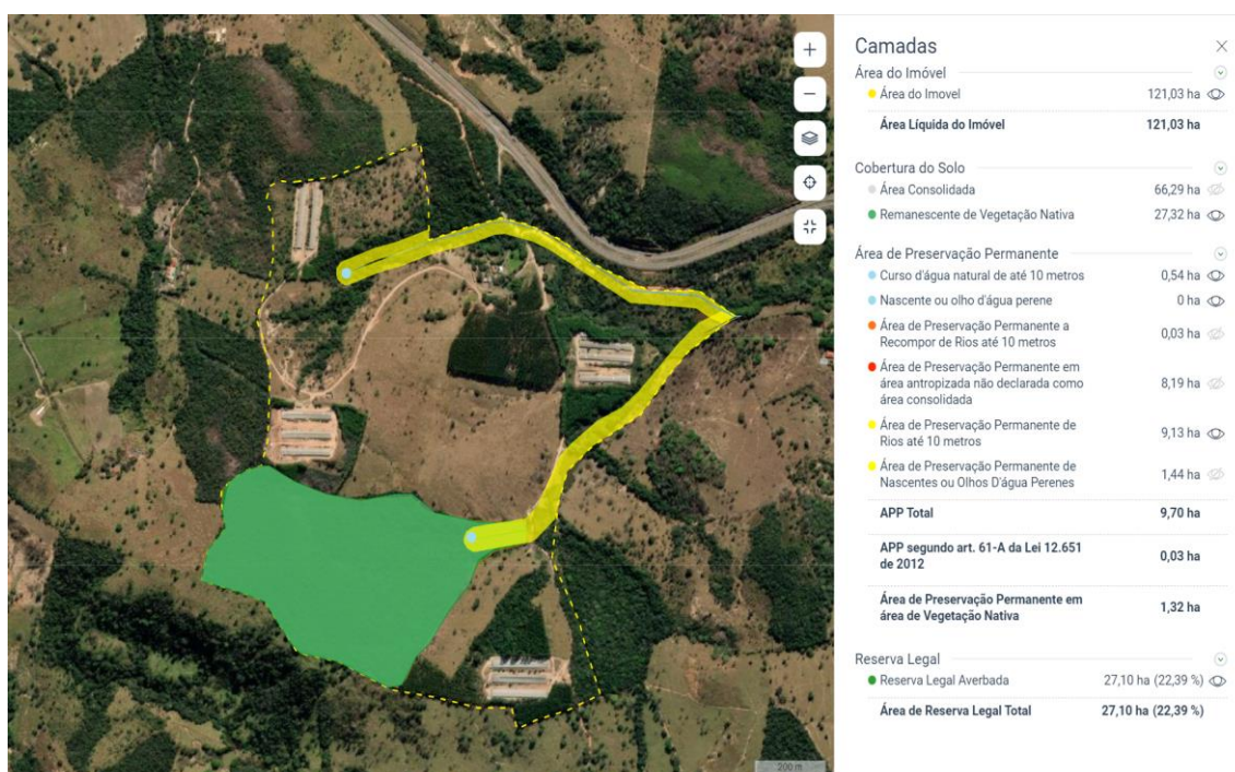
Figura 05. Definição das áreas de APP e reserva legal.

Consta no CAR citado que o empreendimento possui área total de 121,0277 ha, 3,46 módulos fiscais e área de preservação permanente igual à 9,7019 ha, área consolidada de 66,2852 ha, remanescente de vegetação nativa de 27,3153 há e área de reserva legal de 27,1016ha (22,39%).