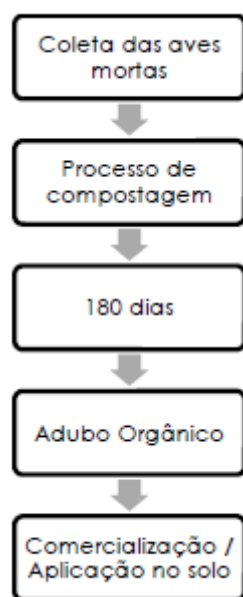
Figura 07. Detalhamento da compostagem das aves mortas.