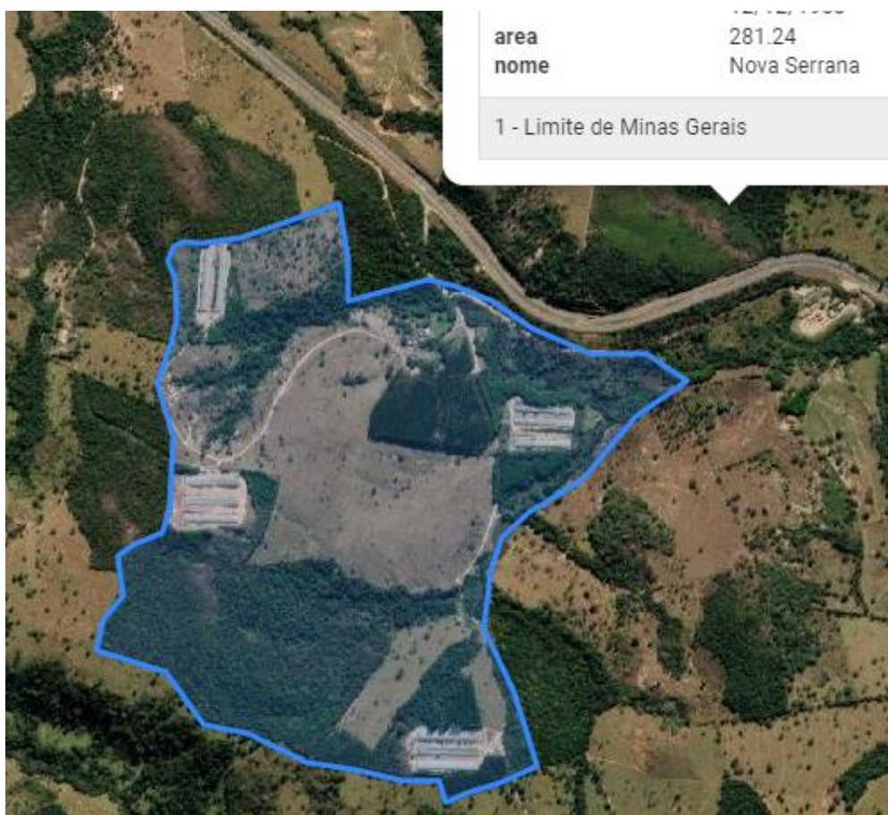
Figura 1 – Localização do empreendimento. Fonte: IDE SISEMA 07/02/2022.