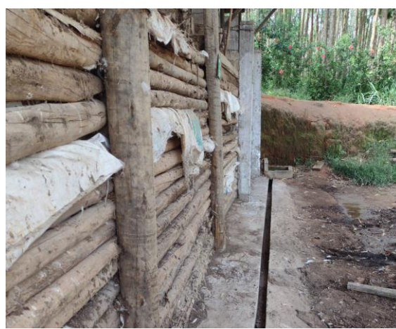
Foto 06. Composteira, canaleta de drenagem de chorume e caixa estanque para armazenamento do material.