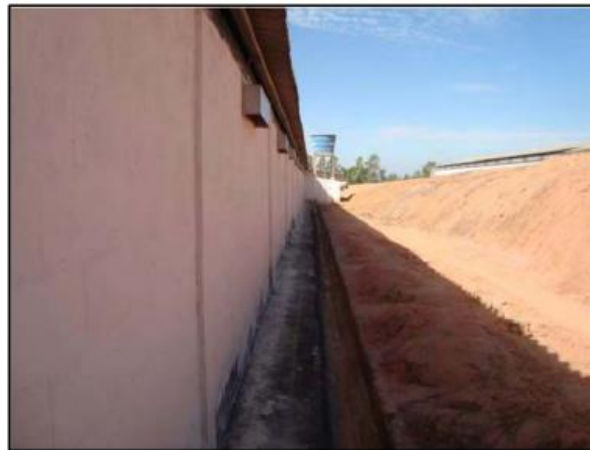
Foto 02. Canaletas de drenagem pluvial