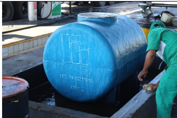
Armazenamento do óleo usado