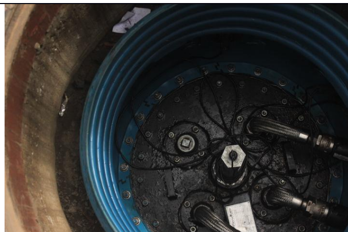
SUMP do tanque com demonstração do monitoramento intersticial