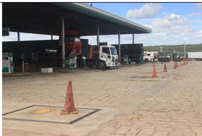
Área de descarga com canaletas.