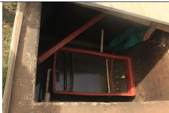
Caixa separadora de água aonde o efluente é bombeado para rede coletora da COPASA