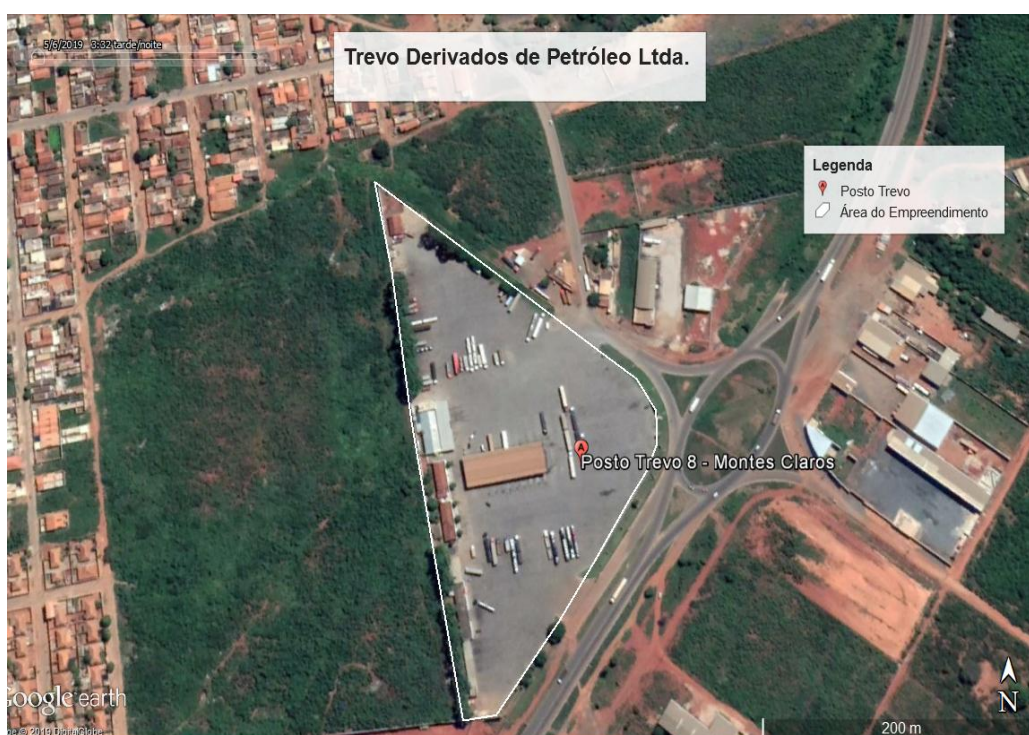
Figura 1. Área do empreendimento Trevo Derivados de Petróleo Ltda.

Em termos de layout , o empreendimento é composto pela área do SASC, pista de abastecimento e troca de óleo, edificações de infraestruturas (escritório administrativo, vestiário, restaurante, lojas de conveniência, oficina e borracharia) e estacionamento.