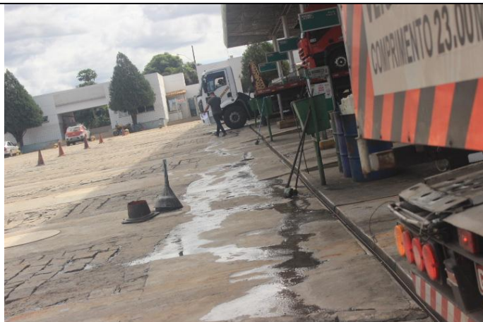
Canaletas sob a projeção da cobertura