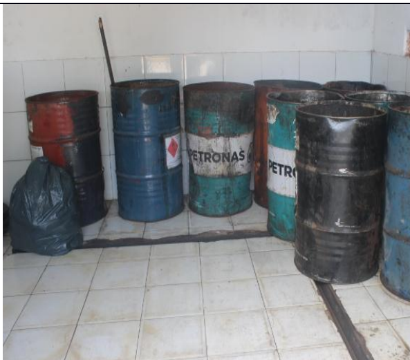
Depósito de armazenamento temporário de resíduos perigosos