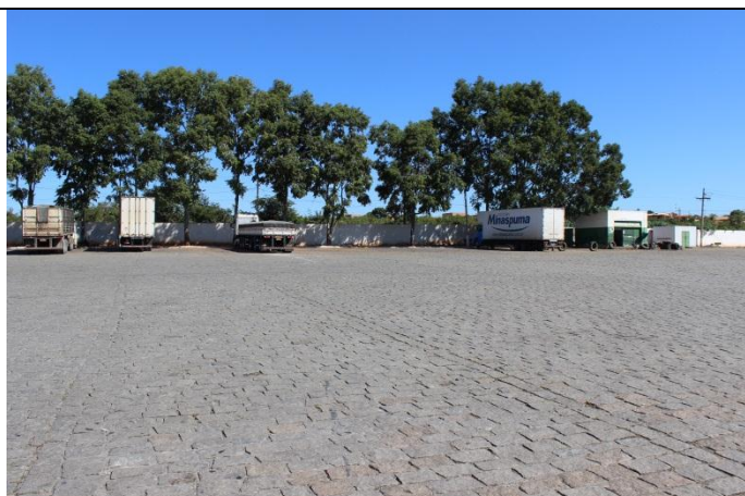
Área de circulação e estacionamento