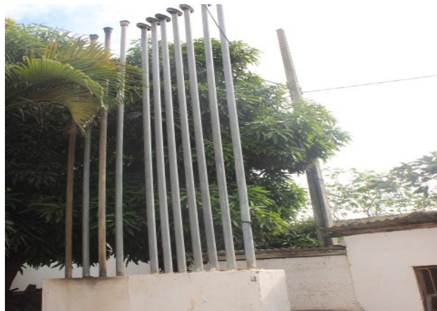
Suspiros dos tanques