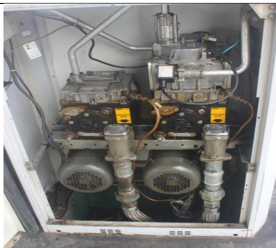
Bombas de abastecimento com SUMP e chekvalve