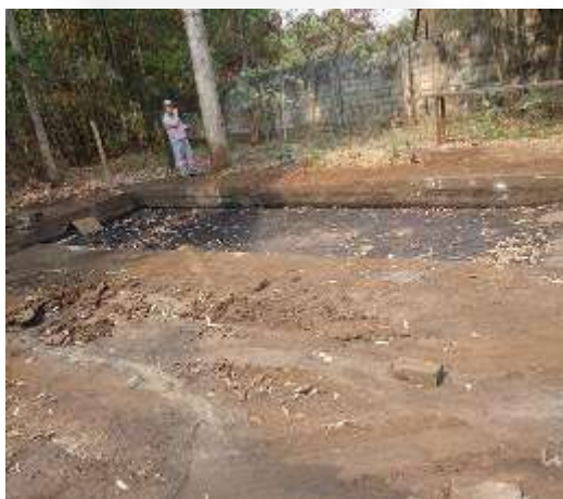
Foto 11. Tanque de decantação de efluentes pluviais assoreado.