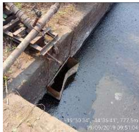
Foto 12. Liberação de efluentes no Ribeirão Paciência com aspecto turvo.