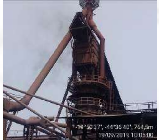
Foto 04. Emissões difusas no topo do alto forno