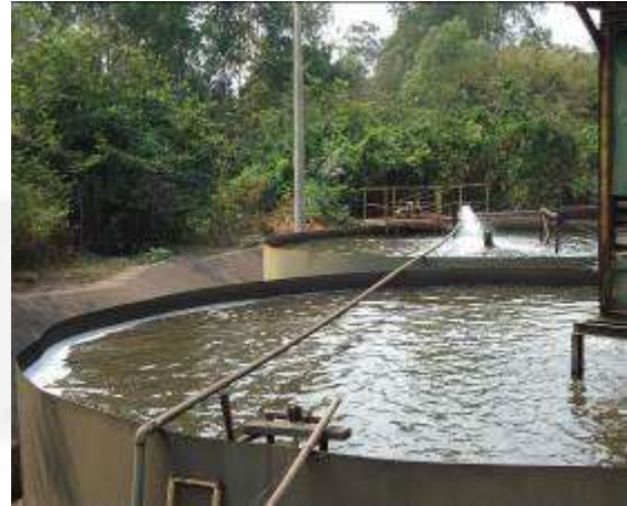
Foto 08. Estruturas existentes na APP.