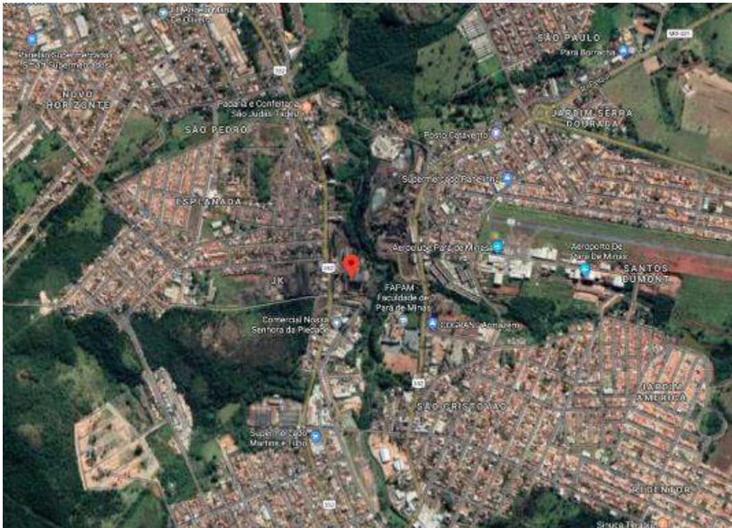
Fig. 1 – Imagem de satélite da empresa (fonte Google Maps).

A empresa Sip Siderurgia Ltda. se encontra instalada à Rua Padre Libério, nº 380, bairro Ozanan, município de Pará de Minas-MG (coordenadas X 540621 e Y 7805745). A imagem abaixo ilustra a localização da empresa.