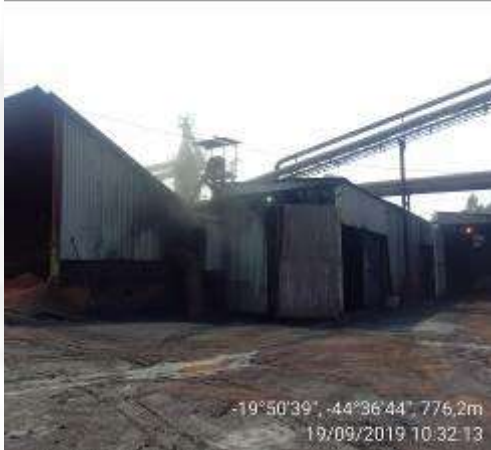
Foto 03. Emissões difusas na descarga e manuseio de carvão vegetal.