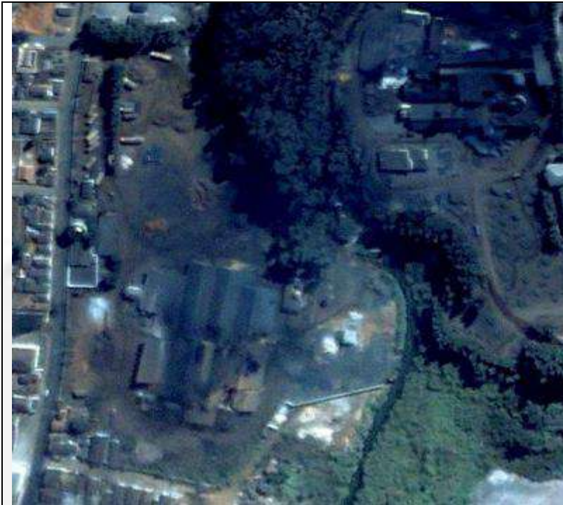
Imagem satélite de 24/06/2000 (anterior a instalação da aciaria)