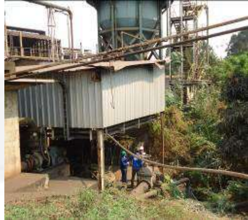
Foto 02. Captação superficial de água.