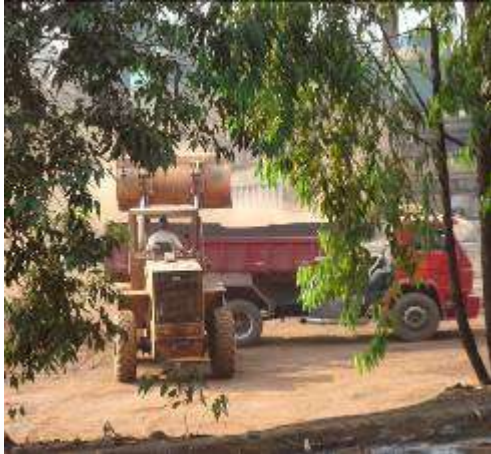
Foto 01. Emissões difusas durante o carregamento de finos nos caminhões.