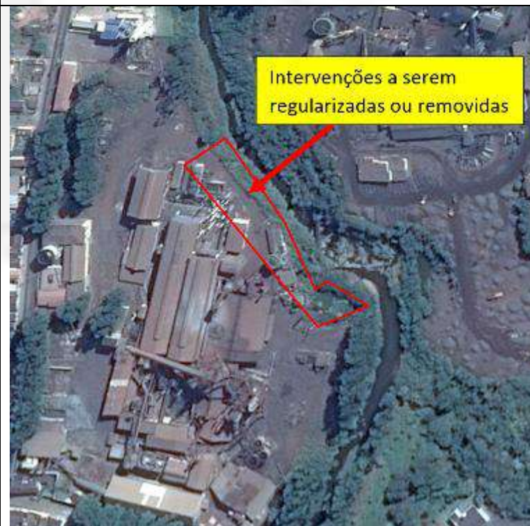
Imagem satélite de 15/06/2013 (posterior a instalação da aciaria)