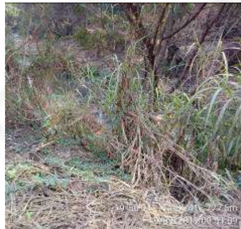
Foto 10. Parte da APP e imagem do Ribeirão Paciência.