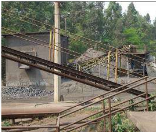
Foto 09. Área de tamboramento de gusa.