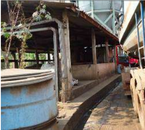
Foto 07. Estruturas e vias existentes na APP.