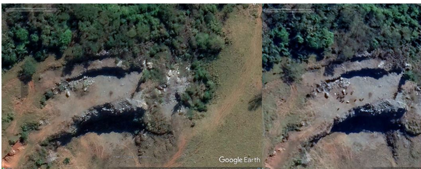
Figura 2. Imagens de satélite referente a área da mina em 2020 e 2021