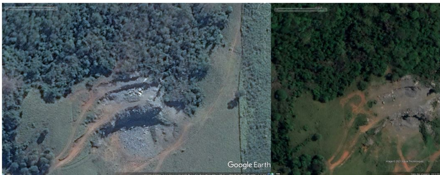
Figura 1. Imagens de satélite referente a área da mina em 2017 e 2018