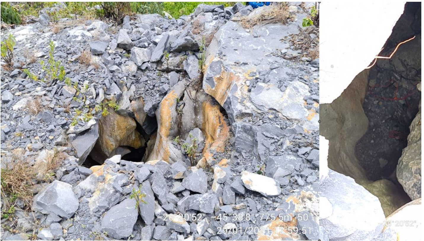
Figura 3. Entrada da cavidade e presença de cordão de detonação em seu interior

Consta no Parecer Único referente ao processo anterior, as condicionantes: