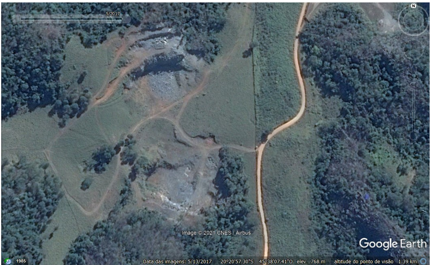
Imagens 5. Área de lavra do empreendimento em 13/05/2017

Condicionante 14: Implementar o projeto de implantação da cortina arbórea no limite da planta de beneficiamento com a estrada Pains- Arcos, destacamos as recomendações deste parecer.