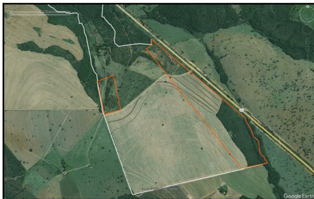
Figura 7. Área do imóvel no ano de 2004.