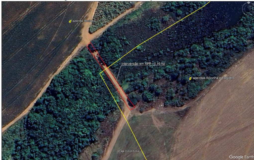
Figura 1. Em vermelho, a área de intervenção em APP - 0,10 ha.