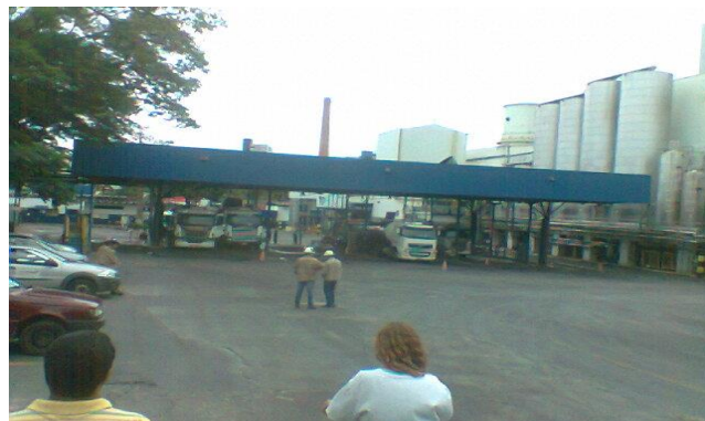
Foto 02 - Visão da recepção de Leite – detalhe: somente carretas e bitrens