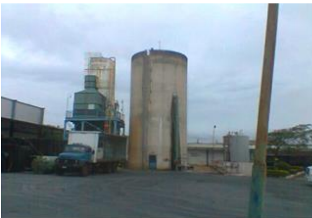
Foto 09 – Visão geral da caixa d'água principal, ETA e armazenagem de produtos químicos.