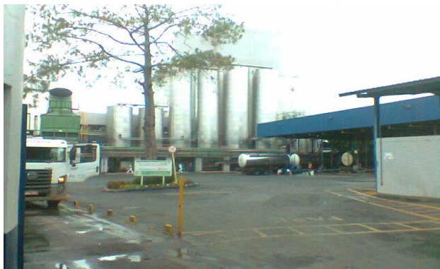
Foto 01 - Visão Geral da perspectiva da portaria do empreendimento

Empreendimento: Fabrica Itambé Município: Sete Lagoas