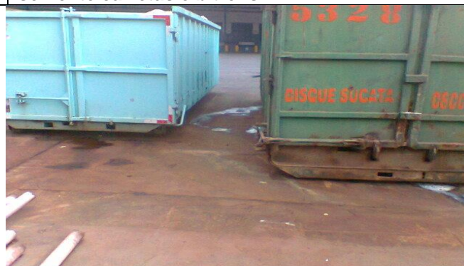
Foto 04 - Detalhe acondicionamento em caçambas com inconformidade /solicitada adequação