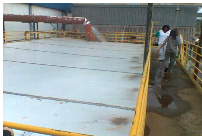
Foto 06 - Detalhe tanque equalização enclausurado com coleta de gás e envio p/ queima na caldeira