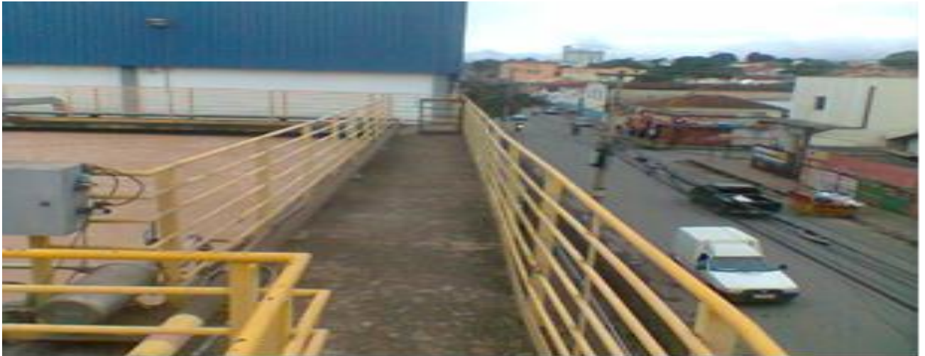
Foto 07 – Visão geral do tanque de aeração e a interface com a Avenida Renato Azeredo