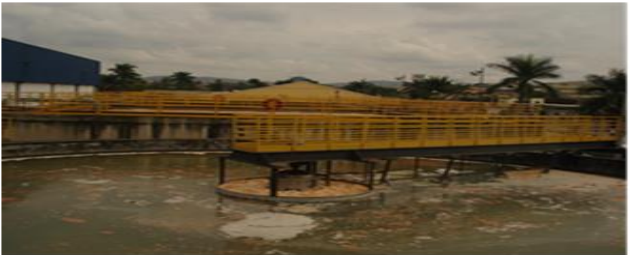
Foto 08 – Visão da ETE em detalhe decantador de lodo