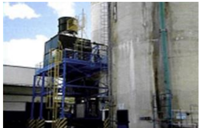
Foto 10 - Detalhe da ETA p/ reaproveitamento da água de condensados.