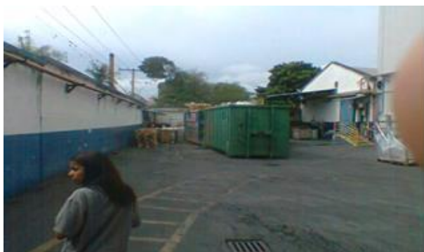
Foto 03 - Segregação temporária de Resíduos recicláveis – fábrica de latas