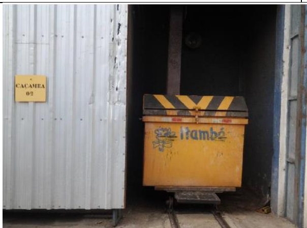
Foto 05 - Detalhe caçamba lodo da ETE (retirada diária) e enclausuramento mitigação de mau cheiro