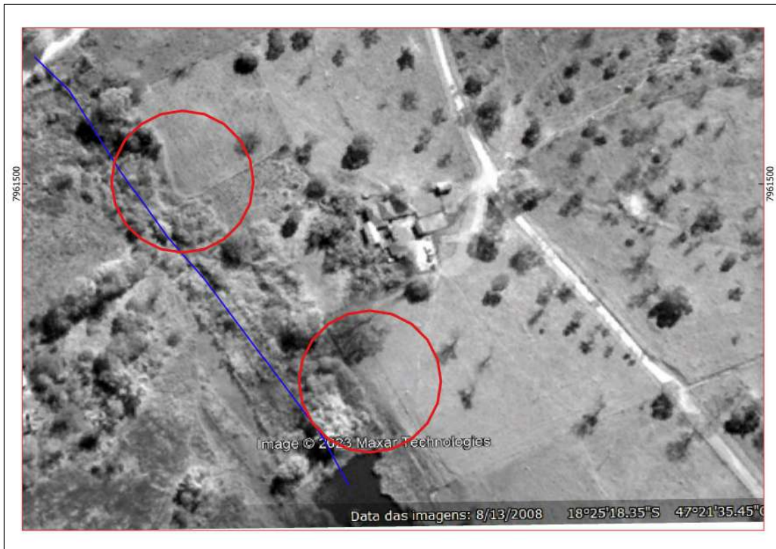
Figura 2 – Imagem obtida por meio do aplicativo Google Earth Pro, corresponde a área de APP antropizada conforme imagem de 2008

Analisando a Figura 1-B, observa que a área apontada como APP não é caracterizada como APP, e sim como vegetação nativa. Também a área de intervenção não sobrepõe a área de vegetação nativa Figura 3, também vale a pena ressaltar que nesta área indicada não possuem indivíduos a serem suprimidos.