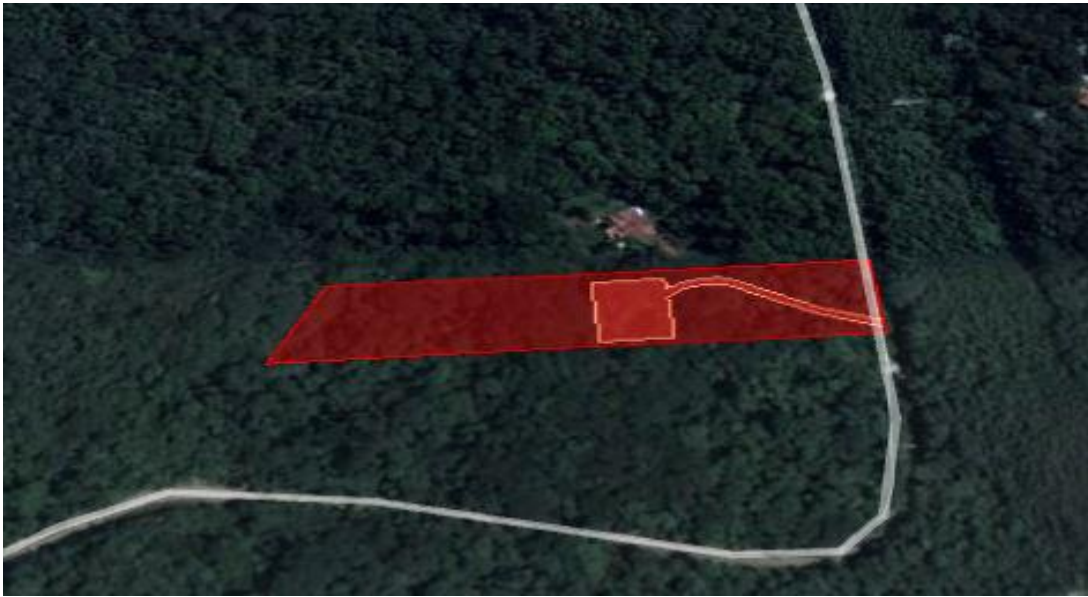
Figura 02- Em vermelho a delimitação da área do lote e em laranja a área de intervenção.