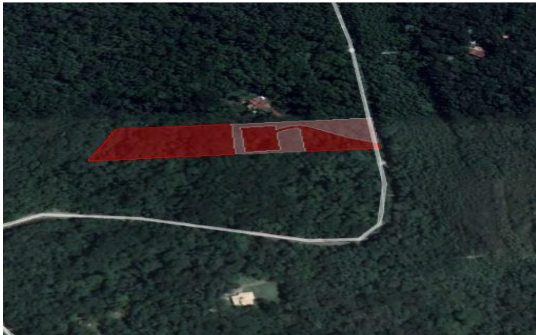
Figura 03- Em marrom delimitação da área de preservação.

Na área requerida para intervenção, constatamos a ocorrência das seguintes espécies nativas arbóreas: