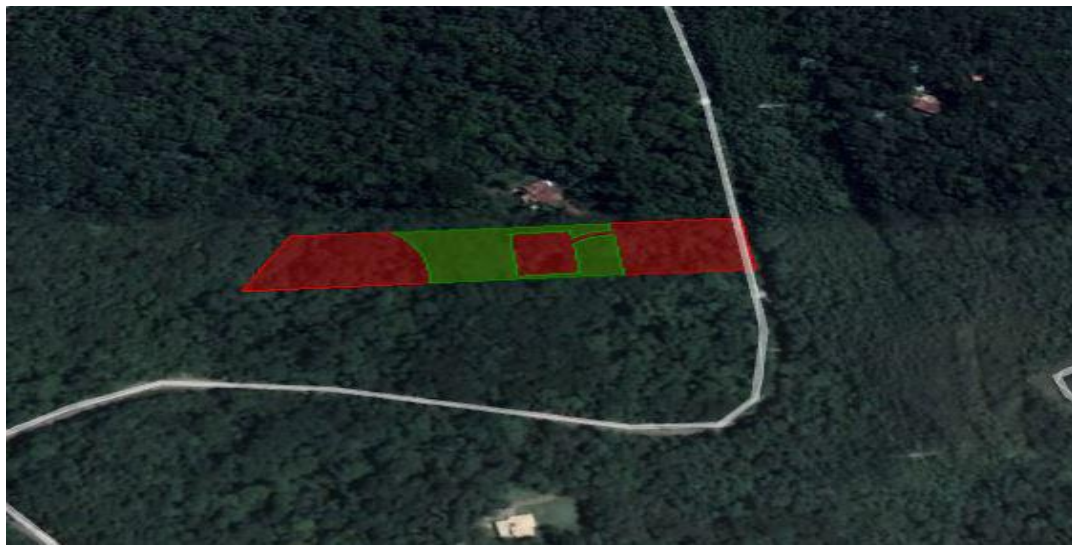
Figura 03- Em verde delimitação da área de preservação.