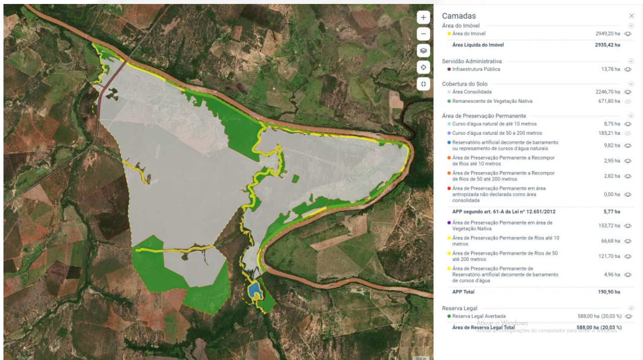
Figura 3. Áreas de Reserva Legal informadas no CAR. Acesso em 10/08/2022.

Atualmente, o empreendimento possui 2.935,4187 hectares de área registrada e reserva legal de 588,0055 hectares informada no CAR sob registro nº MG-3119104-863B222200534CE0981A1F283E082353. Ressalta-se que o empreendimento possui APPs incluídas no cômputo dos 20% da reserva legal, condição prevista nos artigos 35 e 38, da Lei Estadual nº 20.922/2013.