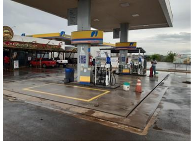
Foto 02. Posta de abastecimento com canaletas