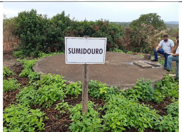
Foto 12. Sumidouro para destinação final dos efluentes tratados