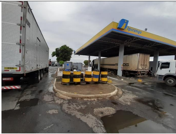
Foto 09. Armazenamento temporário para resíduos sólidos não recicláveis