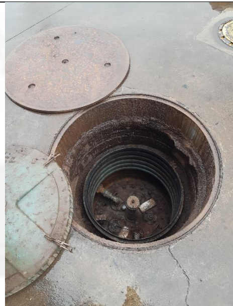
Foto 04. Boca de visita com sump