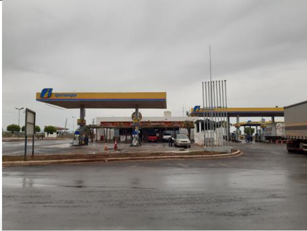
Foto 01. Vista geral do empreendimento.

Relatório Fotográfico para Renovação da Licença de Operação do empreendimento J.A. SOBRAL & CIA LTDA.