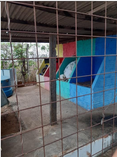
Foto 07. Área de armazenamento de resíduos sólidos recicláveis