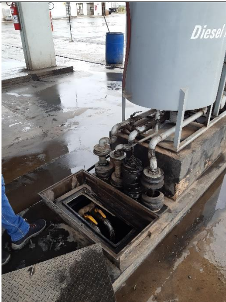
Foto 05. Filtro de diesel com sump