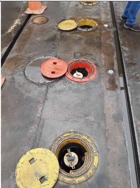
Foto 03. Área de descarga de combustíveis com sump e sistema para descarga selada