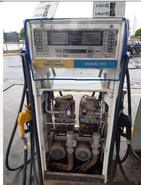
Foto 06. Bomba de abastecimento com check-valve e sump