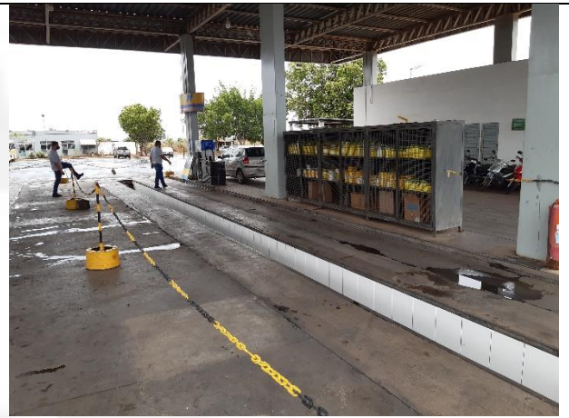
Foto 10. Área de troca de óleo