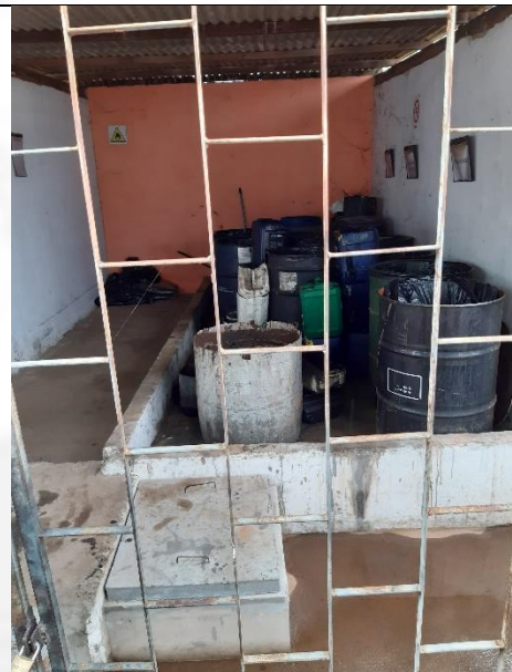
Foto 08. Área de armazenamento de resíduos classe I