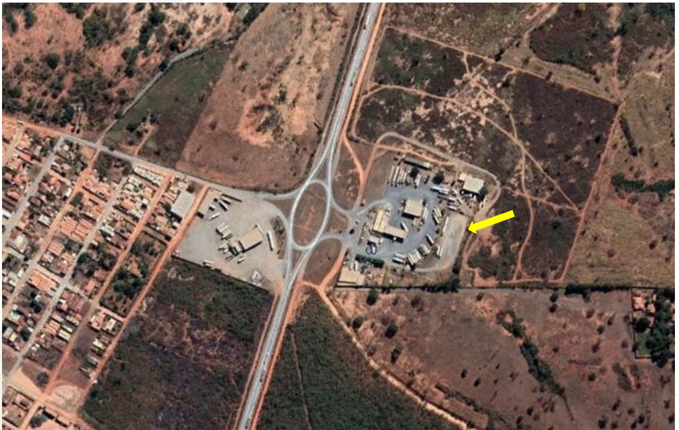
Figura 01: Imagem de satélite do J.A. SOBRAL & CIA Ltda.

O empreendimento possui área total de 53.789,19 m 2 , sendo a área construída de 2.023,09 m 2 . A infraestrutura do empreendimento é composta pelo Sistema de Armazenamento Subterrâneo de Combustíveis (SASC), 03 pistas de abastecimento de veículos, área para descarregamento de combustível, prédio administrativo, restaurante, loja de conveniência e áreas de estacionamento.