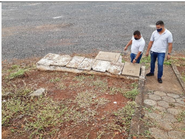
Foto 11. Caixa separadora de água e óleo