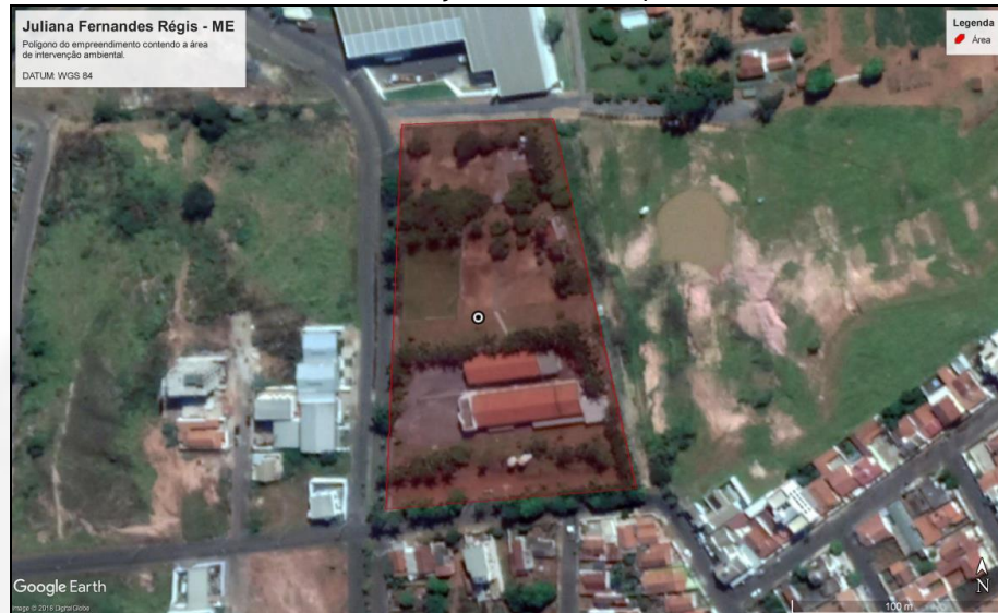
FIGURA 1: Localização e área do empreendimento.

consumo humano. O lixo doméstico é recolhido pelo município e o esgoto sanitário direcionado para fossa séptica e em seguida para a rede pública de coleta (COPASA).