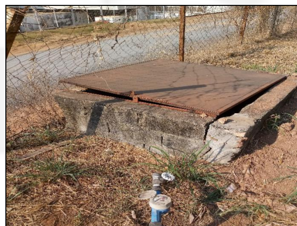
Figura 4: Poço tubular.