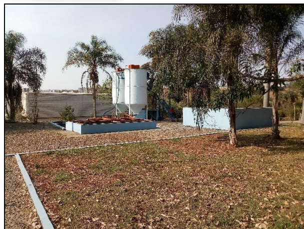
Figura 2: ETE e Fossa Séptica.