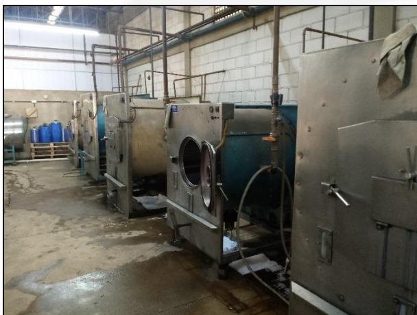
Figura 1: Processo produtivo.