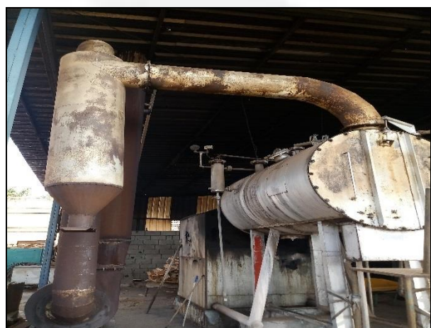
Figura 3: Caldeira.