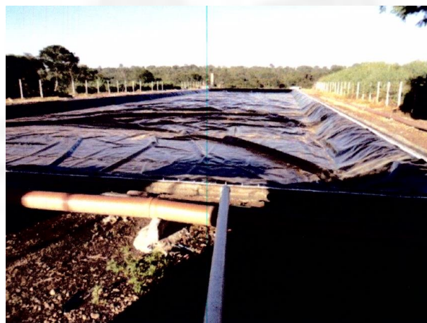
Foto 11. Biodigestor após manutenção.