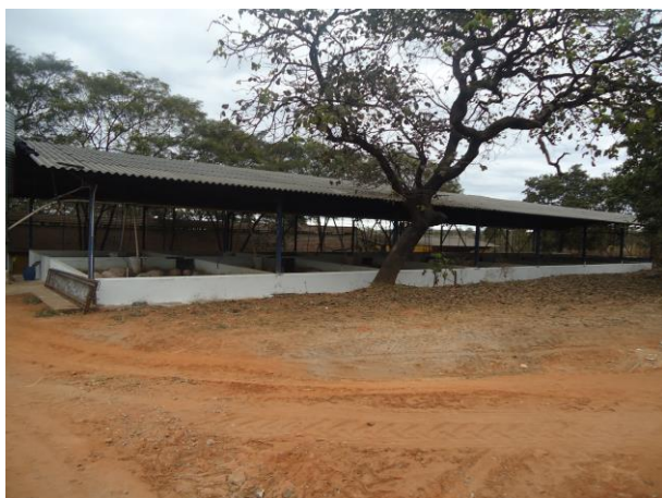
Foto 02. Vista lateral do galpão da suinocultura.