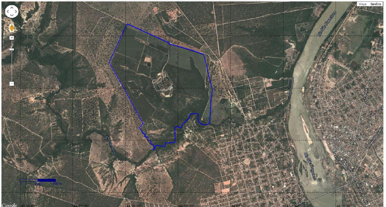
Foto 01- Localização do Empreendimento em relação às cidades de Buritizeiro e Pirapora.