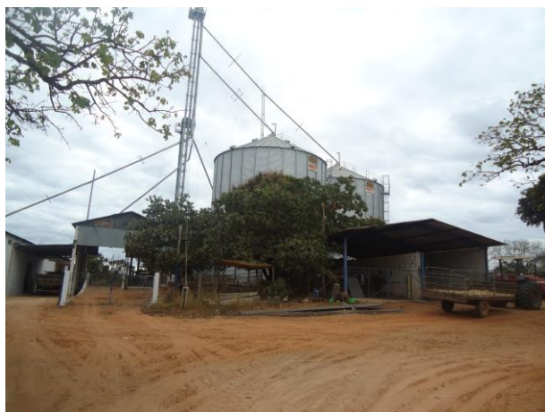
Foto 08. Vista da fábrica de rações com o conjunto silos metálicos.