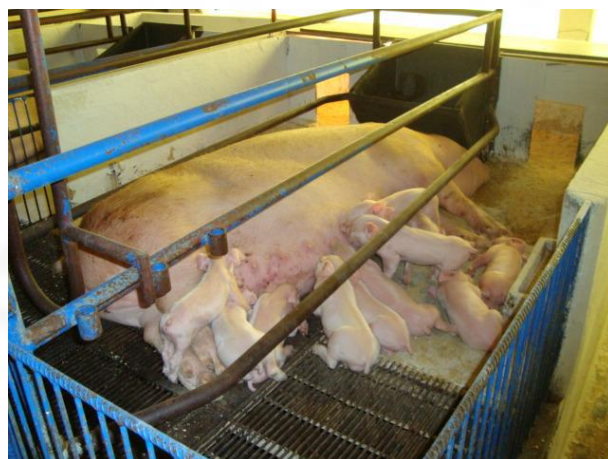
Foto 05. Vista de uma gaiola de maternidade