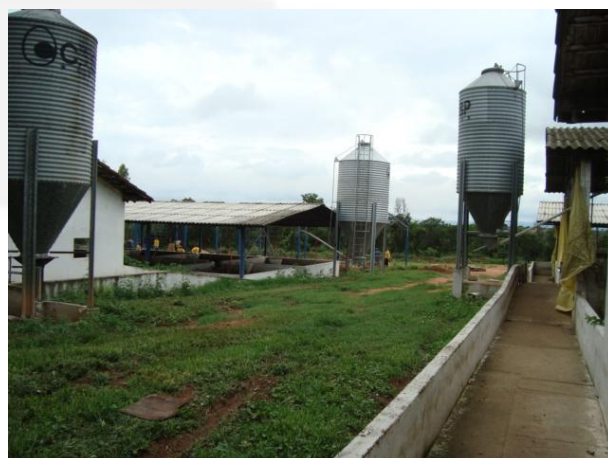
Foto 07. Vista interna da área da granja.