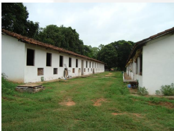
Foto 06. Vista externa de um galpão de creche a esquerda e outro de engorda à direita.