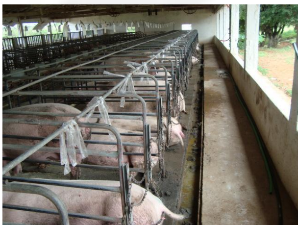
Foto 04. Vista da parte traseira de um conjunto de gaiolas de gestação