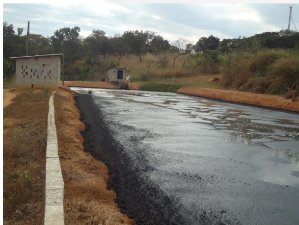
Foto 12. Antiga lagoa após o biodigestor.