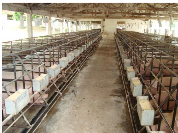
Foto 03. Vista de um galpão de gestação, corredor central.