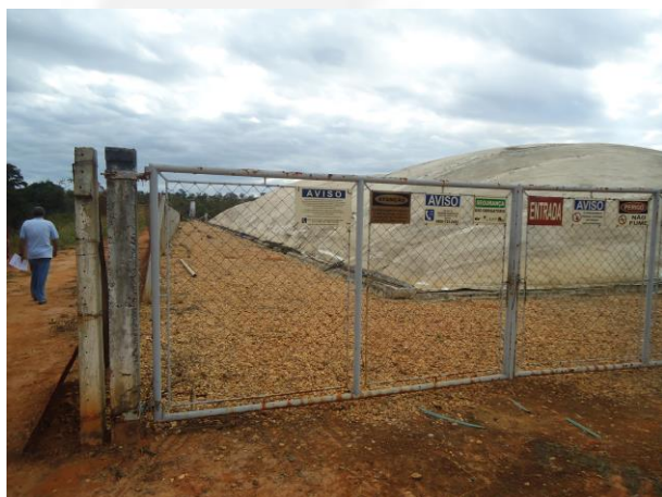
Foto 10. Biodigestor antes da manutenção.