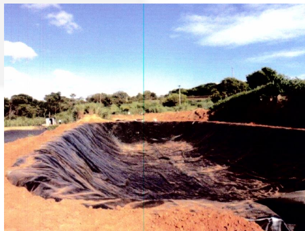
Foto 13. Lagoa construída após o biodigestor, à esquerda esta a antiga lagoa.