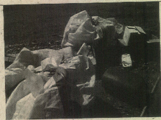
Foto 3: Embalagens diversas de produtos utilizados no empreendimento.