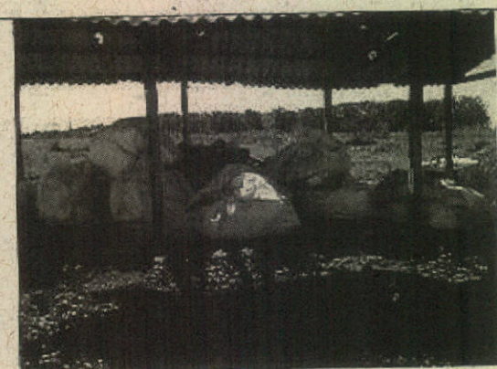
Foto 5: Local de armazenamento de embalagens vazias de agrotóxicos.