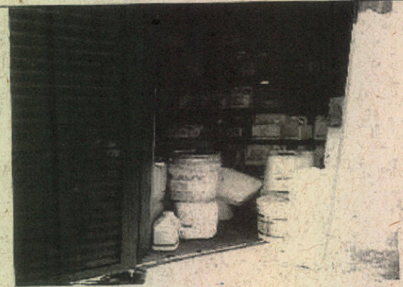
Foto 6: Local de armazenamento de agrotóxicos, sem canaletas e caixa de contenção.