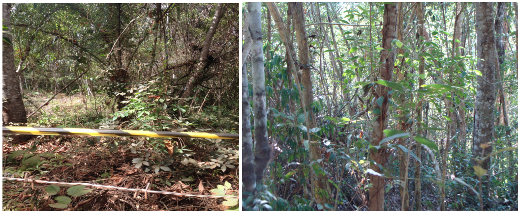
Fotos 01 e 02 - Ilustra área de intervenção.

O quadro a seguir mostra em síntese as características da área intervinda: