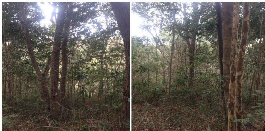
Foto 03 e 04- Área proposta para compensação.

A área onde ocorrerá a compensação florestal será no próprio lote, localizada nos fundos do lote, as características ambientais são aquelas informadas na caracterização da área de intervenção. O referido fragmento se apresenta de forma adensada, conforme Fotos 3 e 4 .