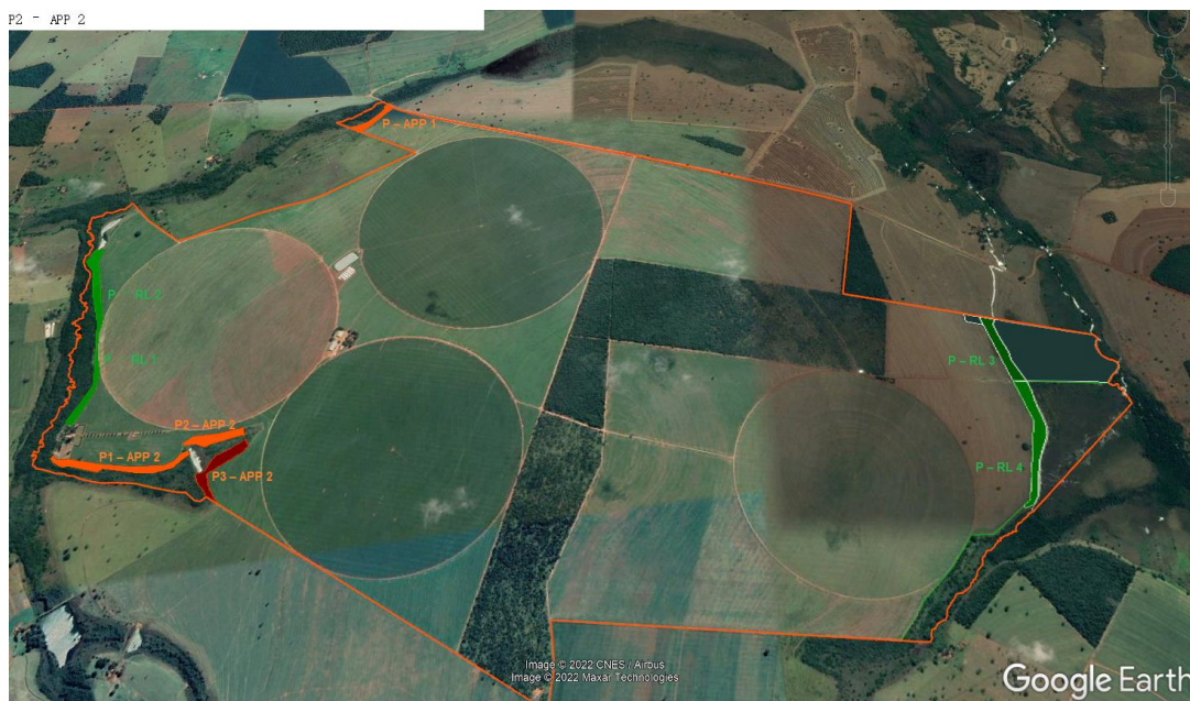
Figura 3. Delimitações de APP (laranja e vermelho) e de RL (verde) objeto do PTRF.