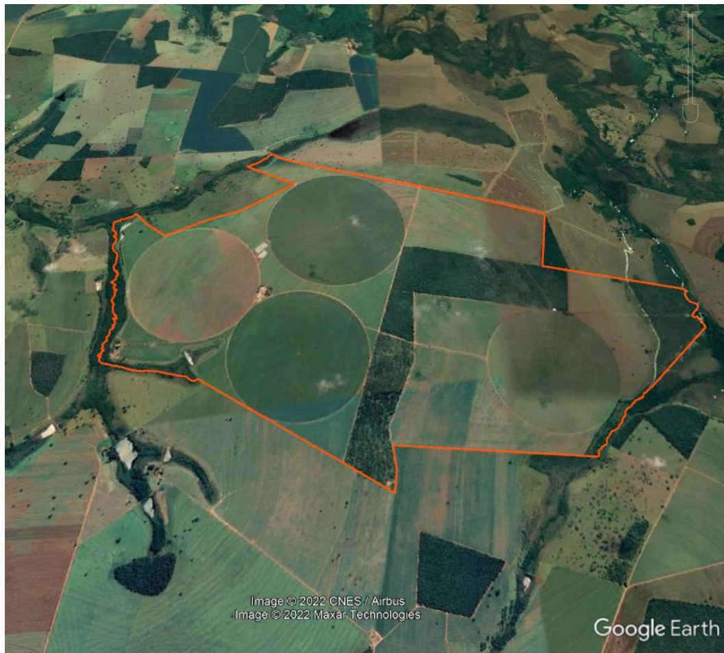
Figura 1. Delimitação da área do empreendimento (em vermelho).