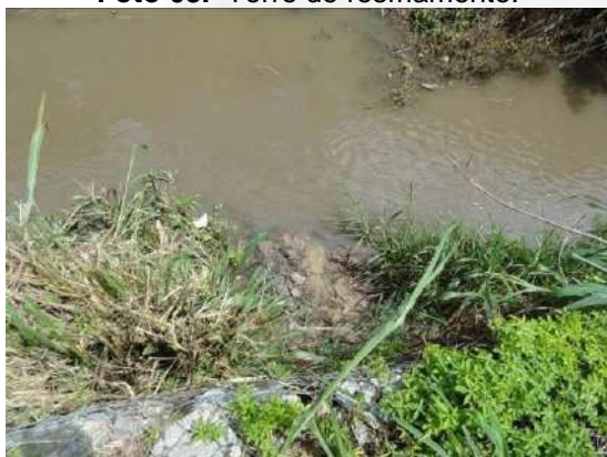
Foto 05. Ponto de lançamento de efluente.