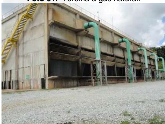
Foto 03. Torre de resfriamento.