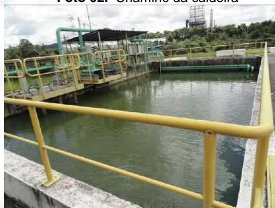
Foto 04. Tanque de equalização.