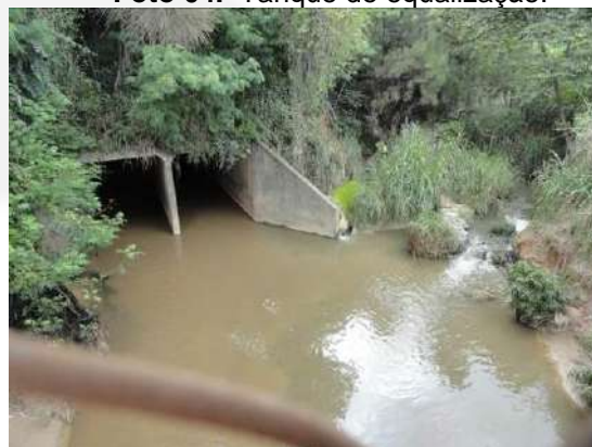
Foto 06. Local de confluência de efluentes