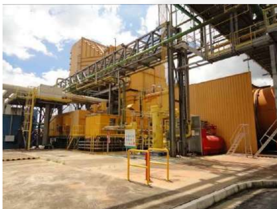
Foto 01. Turbina a gás natural.

Empreendedor: IBIRITERMO S.A. Empreendimento: IBIRITERMO S.A. CNPJ: 04.552.973/0001-94 Município: Ibitaré Atividade: Sistema de geração de energia termoeétrica utilizando combustível fóssil Código DN 217/2017: E-02-02-1 Processo: 152/2000/017/2012 Validade: 10 anos