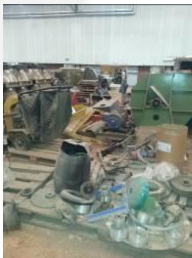
Galpão com resíduos dispostos