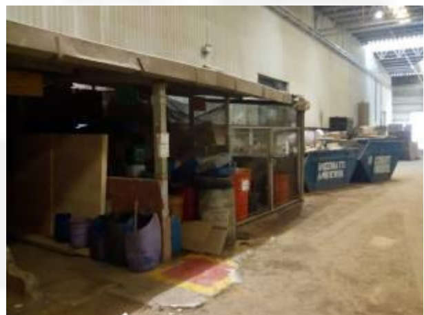
Resíduos classe 1 (no interior de galpão coberto)