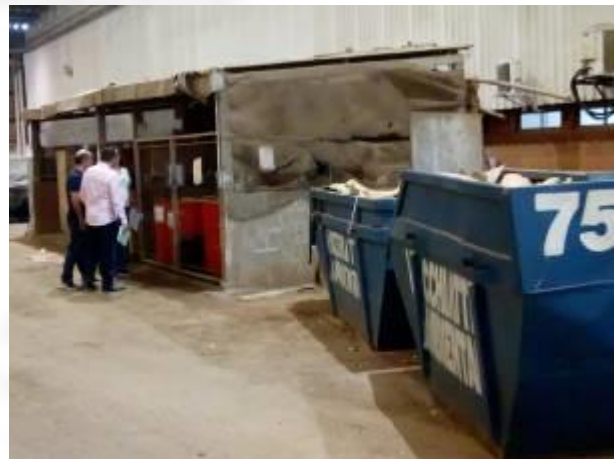
Depósito de resíduos