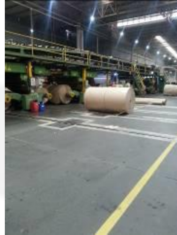
Interior do empreendimento