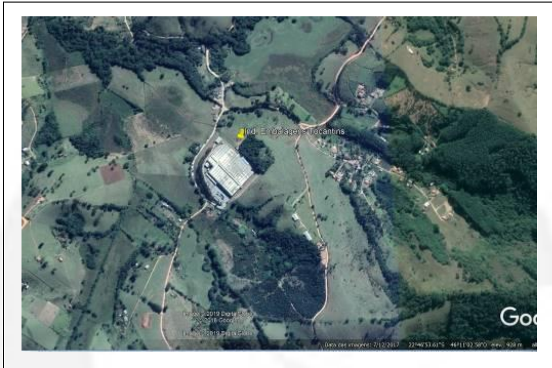
Imagem de satélite de 12/07/2017

O óleo BPF fica armazenado em dois tanques de 15 m 3 , instalados dentro de bacia de contenção e em área cercada. Ao lado fica uma caixa separadora de água e óleo. A lenha fica armazenada em galpão fechado e coberto. Possui Certificado de Consumidor de Lenha, válido.