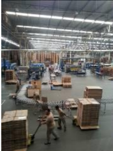
Interior do empreendimento