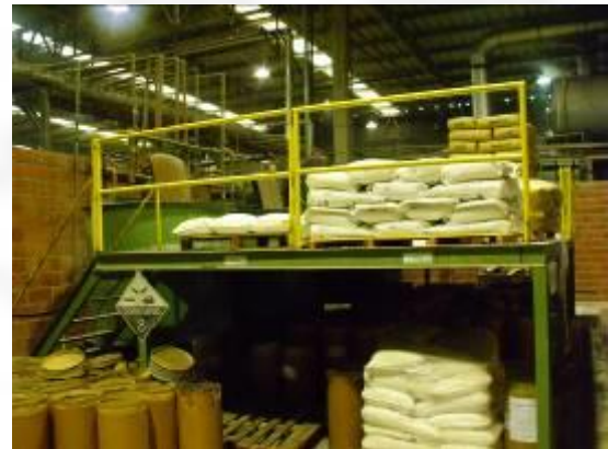
Depósito de químicos