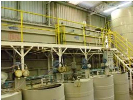
ETE efluentes industriais