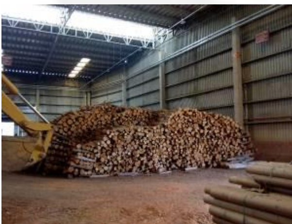
Área de armazenagem de lenha