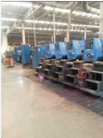
Interior do empreendimento