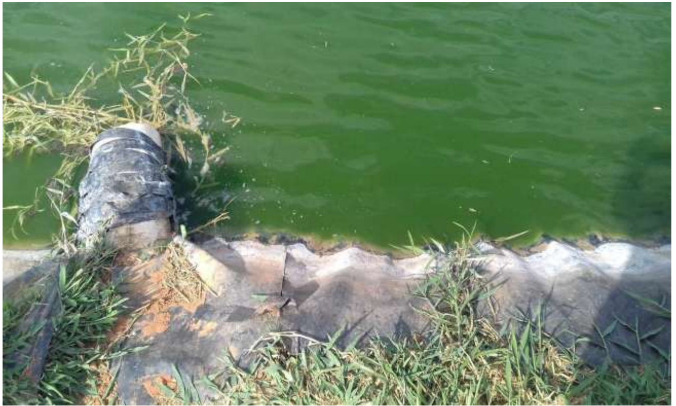
Visão do efluente na lagoa facultativa ( última na sequência de tratamento) do empreendimento – vistoria out/2017 Foto 03.