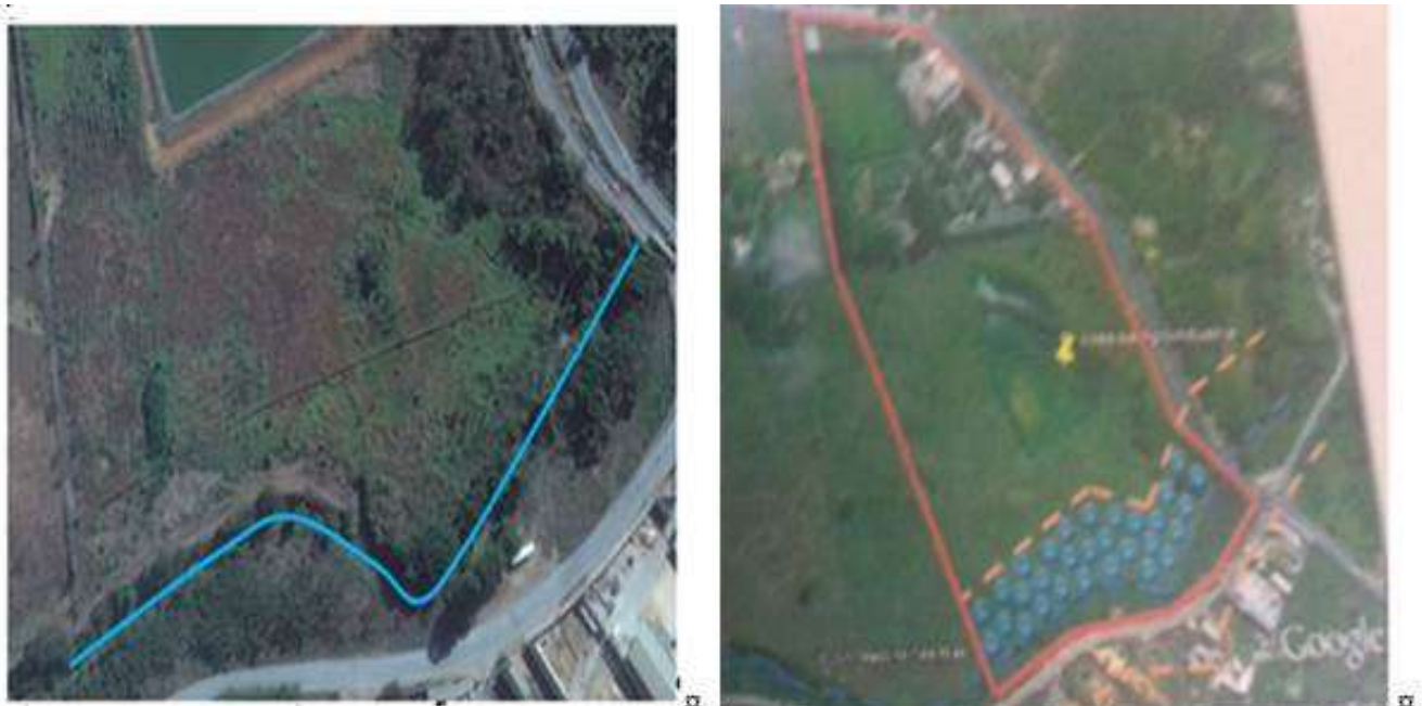
Figura III – Imagens da APP do empreendimento

Fonte: Adaptado PTRF do empreendimento – Doc R135377/2011 de 22/08/2011