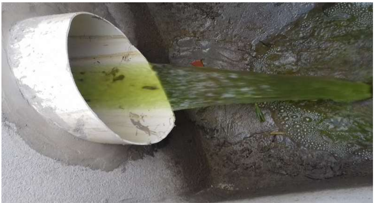
Aspecto visual do efluente tratado na saída da ETE– vistoria out/2017 Foto 04.