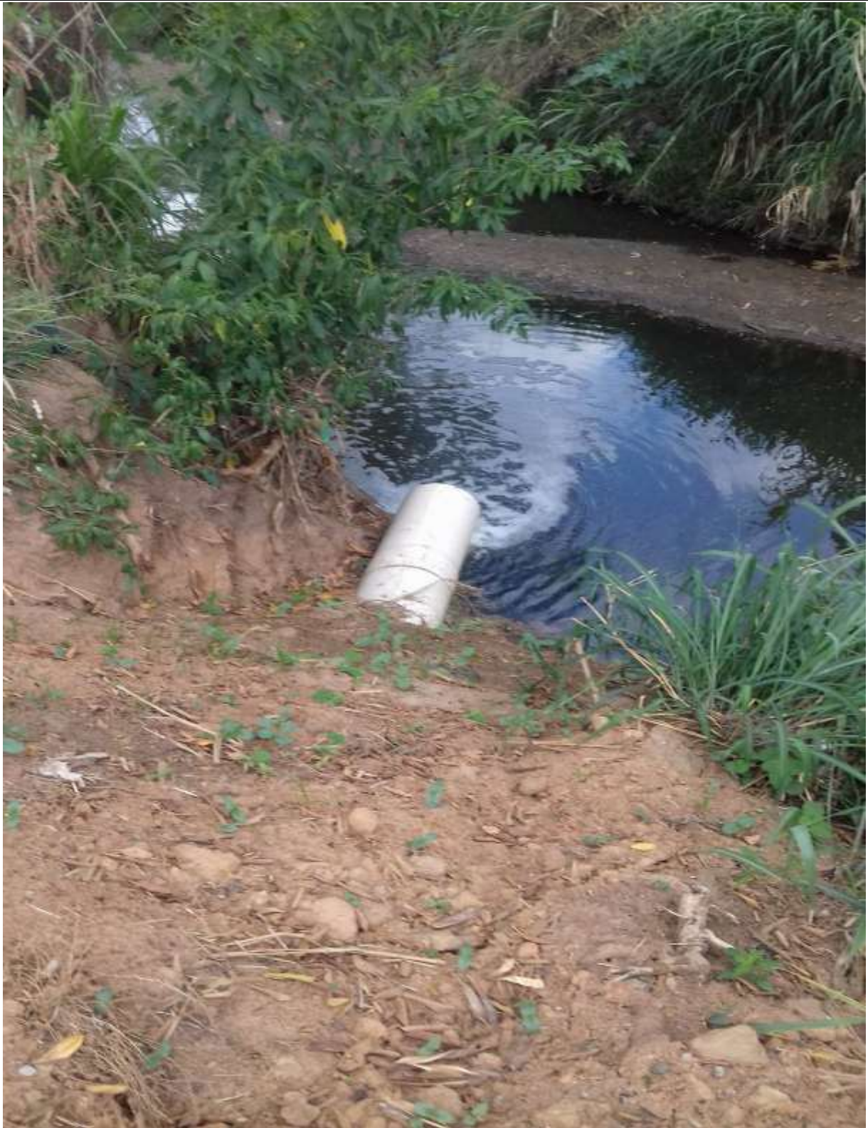
Visão do ponto de lançamento do córrego Diogo - vistoria out/2017 Foto 05.