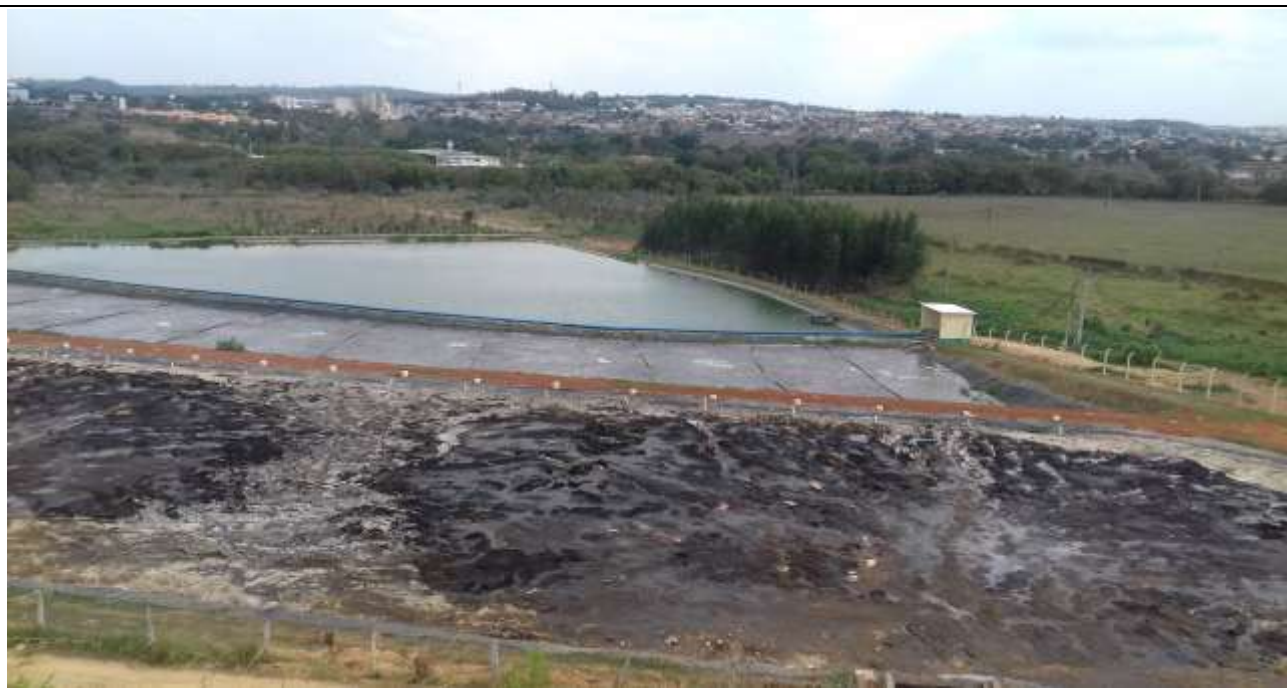
Visão da ETE do empreendimento – vistoria out/2017 Foto 02.