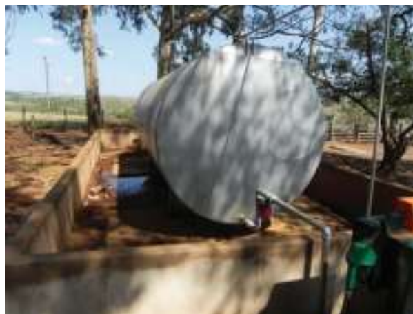
FOTO 02 – Ponto de abastecimento