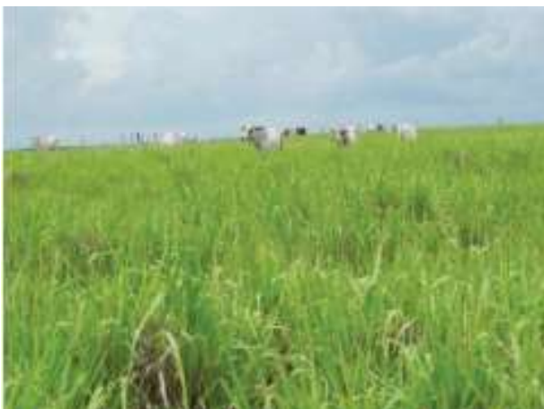
FOTO 01 – Atividade de bovinocultura, regime extensivo.