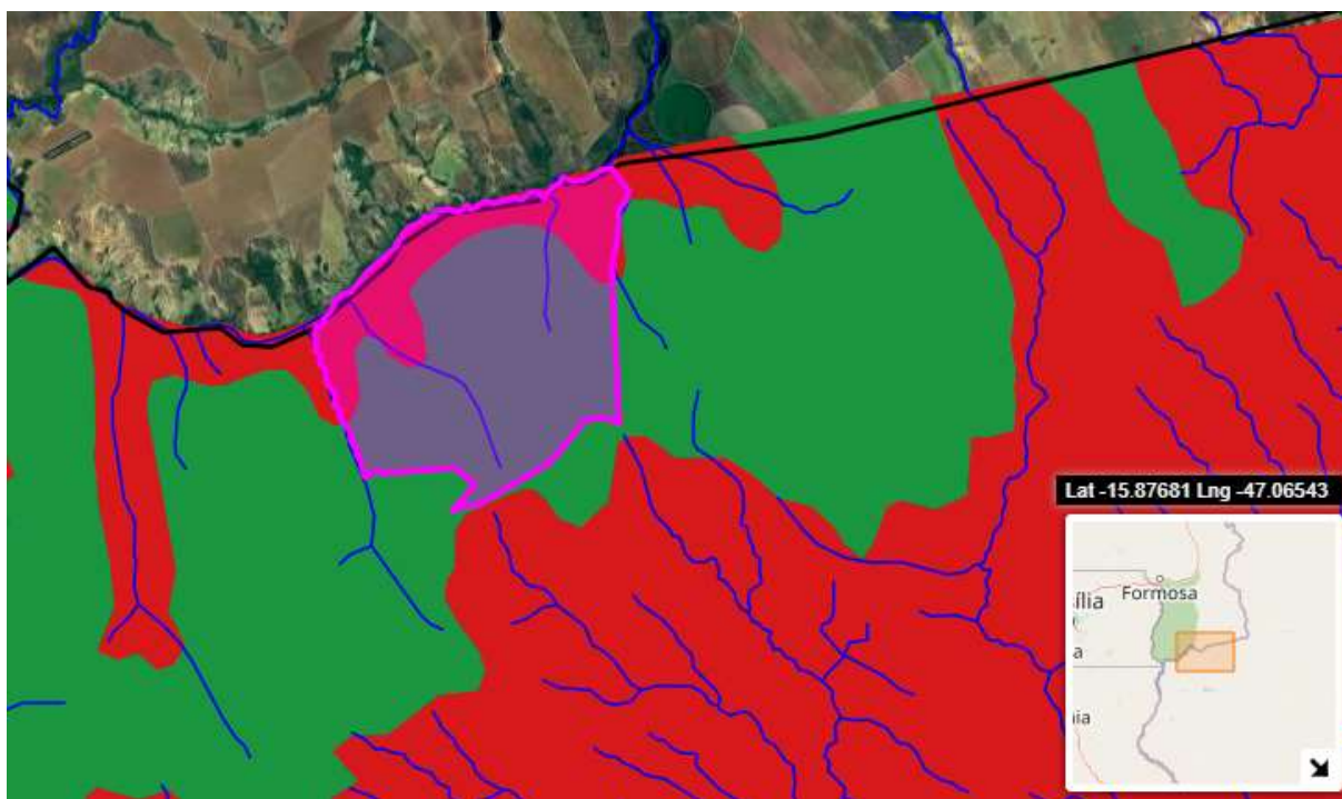
Imagem 02 – Diagnóstico Ambiental do empreendimento.

Está em área pontencialidade de ocorrência de cavidades “muito alto” e “ocorrência improvável”. Não está em Áreas Prioritárias para a Conservação Extrema da Biodiversidade. Nem haverá intervenção em nascentes, veredas, turfeiras ou afloramentos de água, aquíferos ou áreas de recarga.