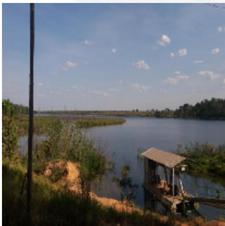
Captação em barramento