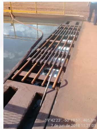
Figura 7- Tratamento dos efluentes líquidos oleosos.