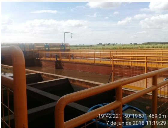
Figura 6- Tratamento dos efluentes líquidos oleosos.

Os resultados da eficiência dessas caixas separadoras apresentaram necessidade de manutenção das caixas. Embora o efluente não seja destinado para sumidouro, é importante manter uma frequência de limpeza para que se possa otimizar ao máximo a eficiência do sistema proposto, antes de ser reutilizado ou ir para o tanque de águas residuárias. O empreendedor apresentou no protocolo R0067635/2019 relatório fotográfico contendo a localização e a comprovação da última inspeção e limpeza.