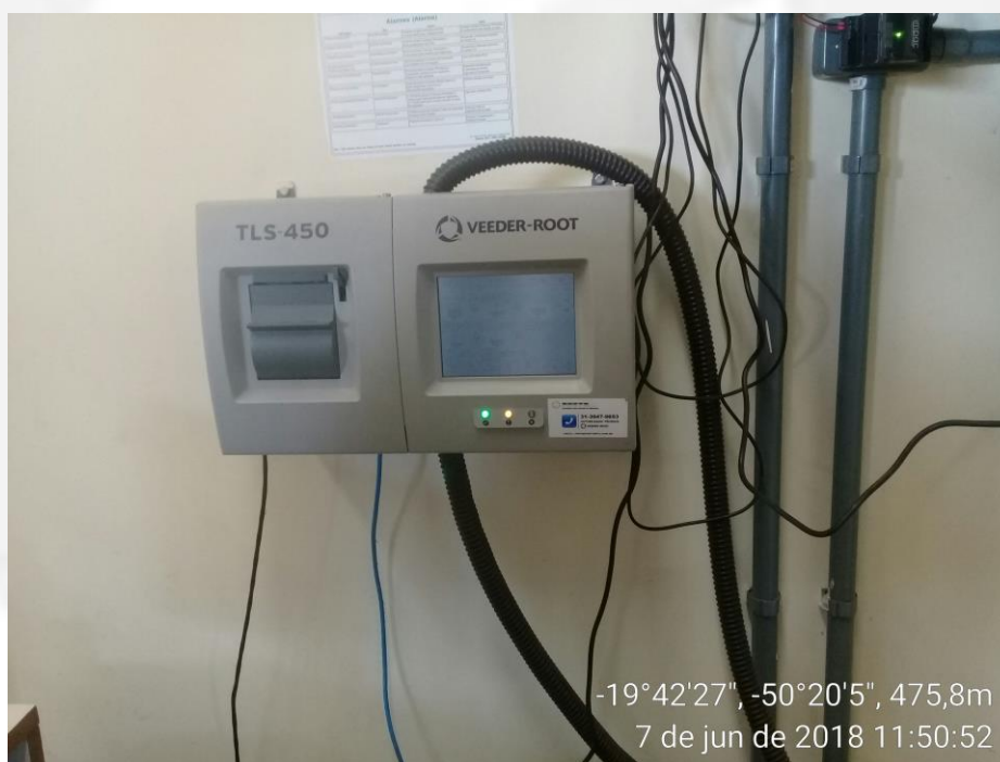
Figura 12- Tela do sistema de monitoramento Intersticial e controle de combustíveis.

No momento da vistoria observamos que o monitoramento eletrônico intersticial de vazamentos estava instalado.