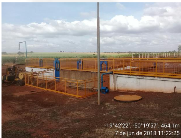
Figura 8- Tratamento dos efluentes líquidos oleosos.