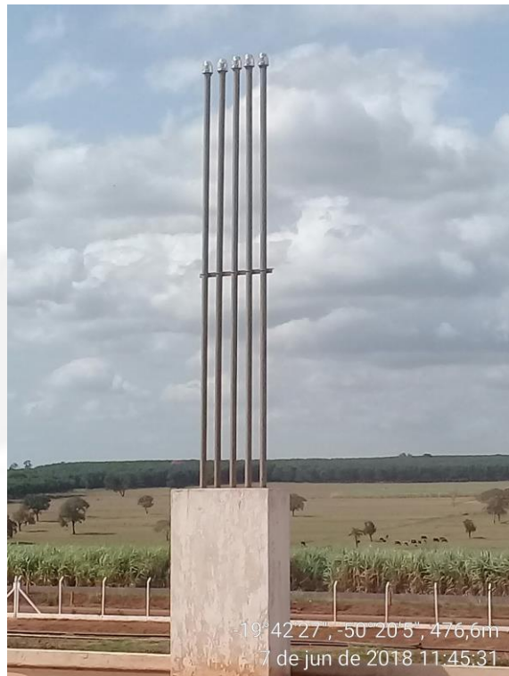
Figura 3- Respiros dos tanques