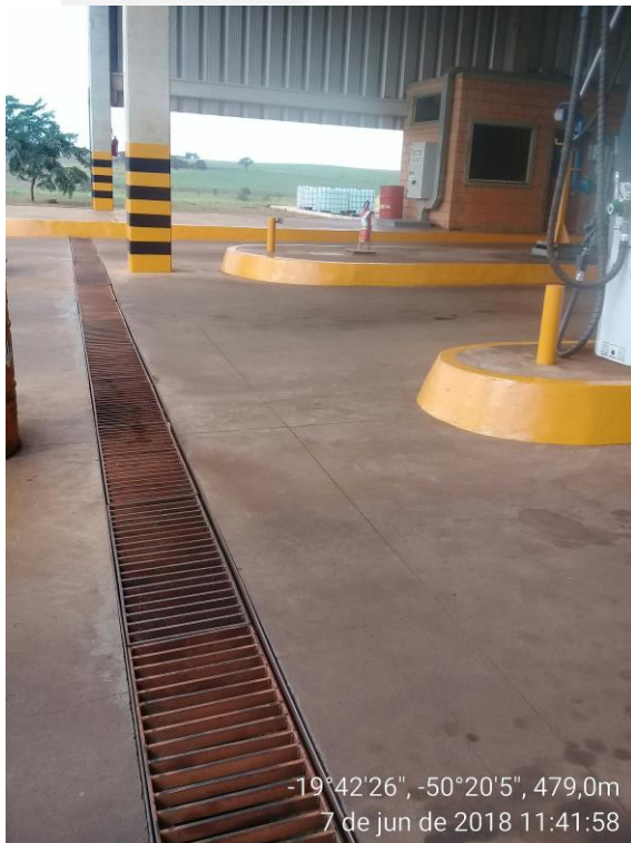
Figura 4- Canaletas de drenagem oleosa