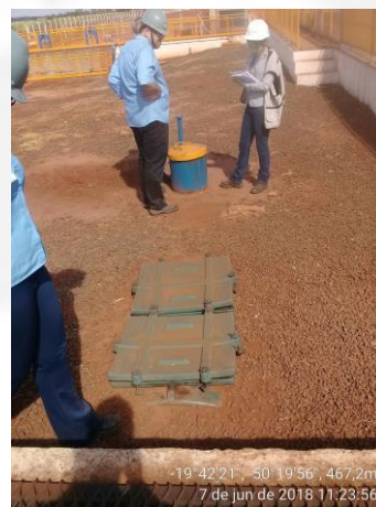
Figura 9- CSAO