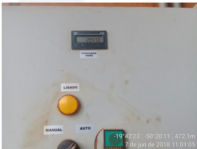
Figura 10- Horímetro

Possui autorização para captar 11 m 3 /h de água, durante 15:26 horas por dia, todos os 12 meses do ano. Esse recurso é utilizado para limpeza e utilização na oficina de máquinas agrícolas e em outros departamentos inseridos no processo da Usina Coruripe. Também é utilizado para consumo humano sendo que, neste caso, passa por processo de filtragem.