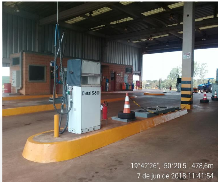
Figura 5- O posto trabalha com 05 bombas de abastecimento sendo uma bomba de alta vazão para abastecimento de óleo diesel.