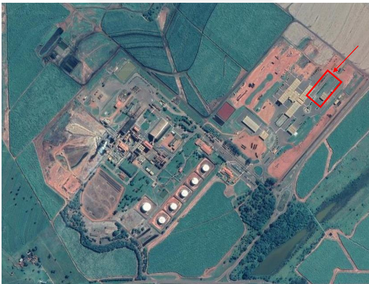
Figura 1- Localização do empreendimento

Opera com 05 (cinco) funcionários, 03 turnos por dia, durante 8 horas/dia, todos os dias e meses do ano. O empreendimento existe especificamente para abastecimento da frota de veículos da Usina Coruripe S.A. e está localizado paralelo ao complexo da Usina, sendo esta última detentora da Licença de Operação 211/2019 (processo 60/1983/014/2016).