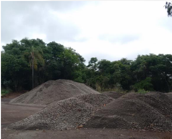
Foto 01. Área de mata nativa suprimida para armazenamento de escória.