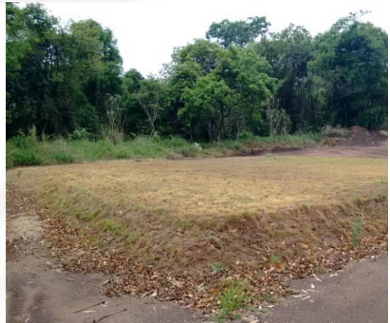
Foto 02. Área de mata nativa suprimida para armazenamento de escória (não se sabe o que estava depositado debaixo da grama)