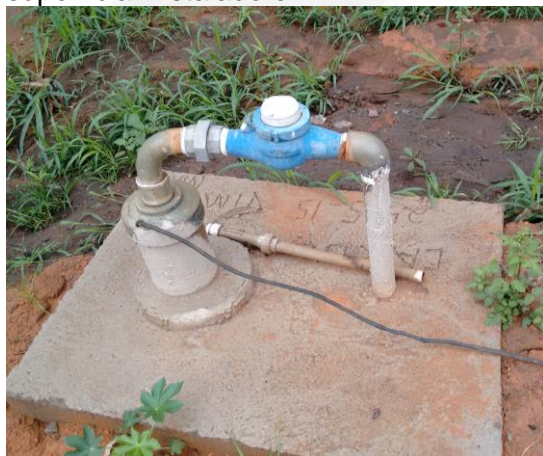
Foto 07. Poço tubular.