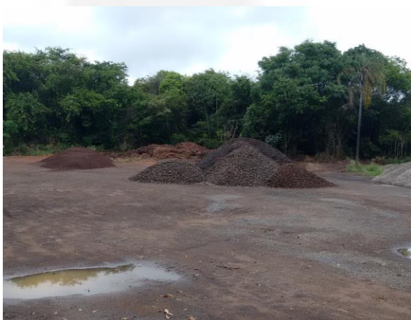
Foto 03. Área de mata nativa suprimida para armazenamento de escória.