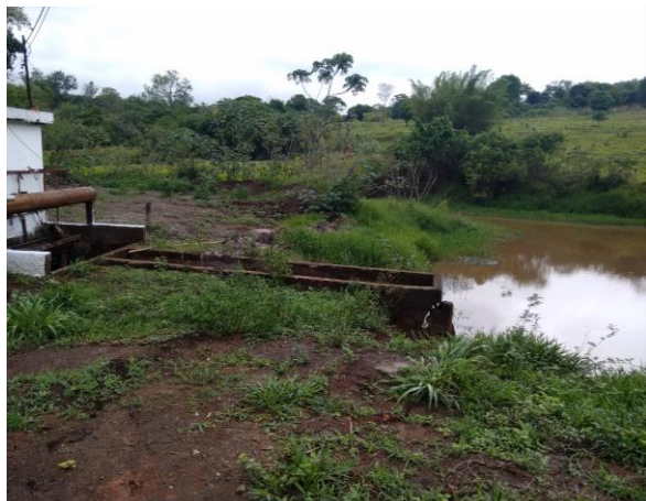
Foto 05. Ponto de captação de água superficial instalado em APP.