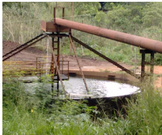
Foto 08. Tanques de água instalado em APP