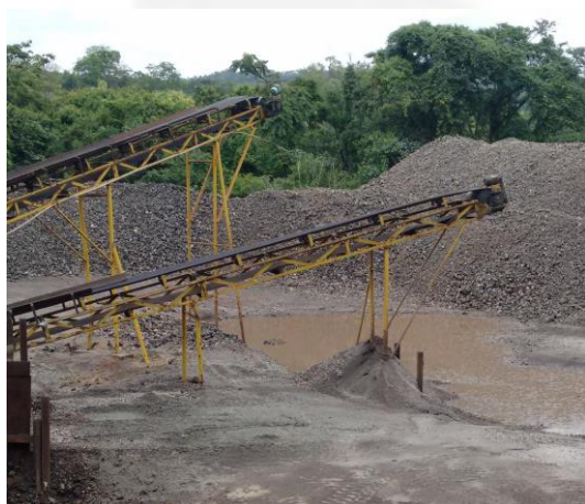
Foto 09. Área de mata nativa suprimida e usada para beneficiamento de escória