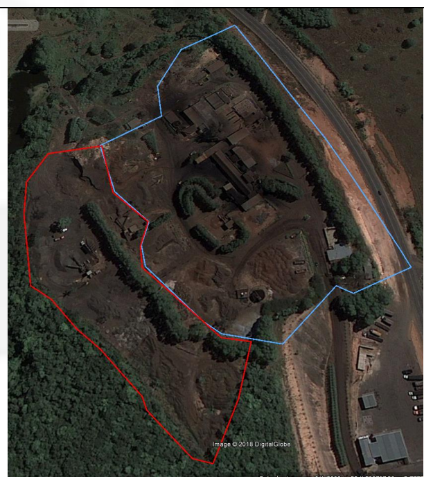
Imagem Google Earth de 01/09/2009