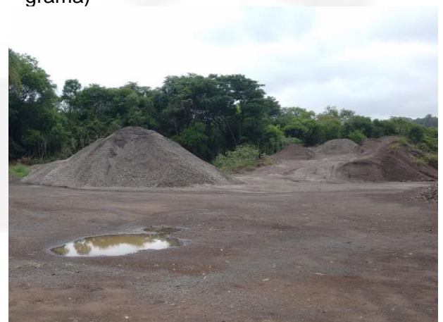
Foto 04. Área de mata nativa suprimida para armazenamento de escória.