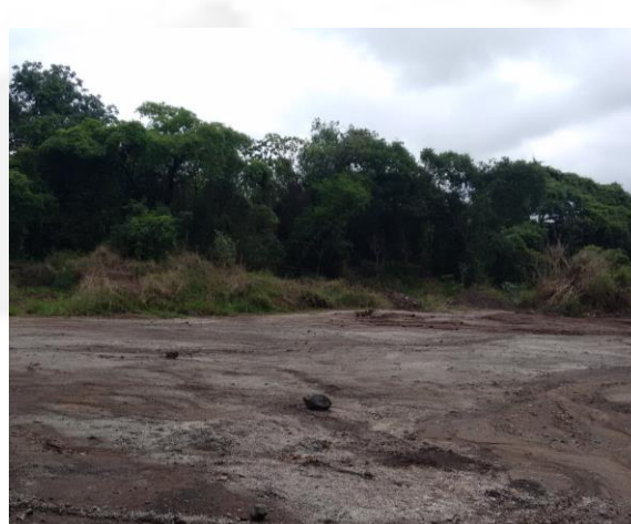
Foto 10. Área de mata nativa suprimida para armazenamento de escória.