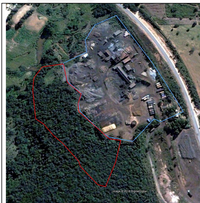
Imagem Google Earth de 30/12/2007

Verificou-se, através de imagens de satélite disponíveis no Google Earth , supressão de vegetação nativa em mais de dois hectares entre 30/12/2007 e 01/09/2009, conforme imagens abaixo: