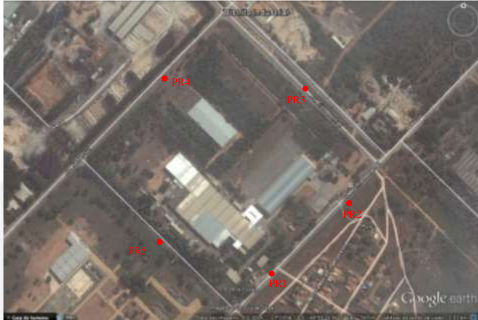
Figura 2 – Pontos de monitoramento dos níveis de ruído

O laudo deverá ser de laboratórios em conformidade com a DN COPAM n.º 167/2011 e deve conter a identificação, registro profissional e a assinatura do responsável técnico pelas análises, acompanhado da respectiva anotação de responsabilidade técnica – ART.