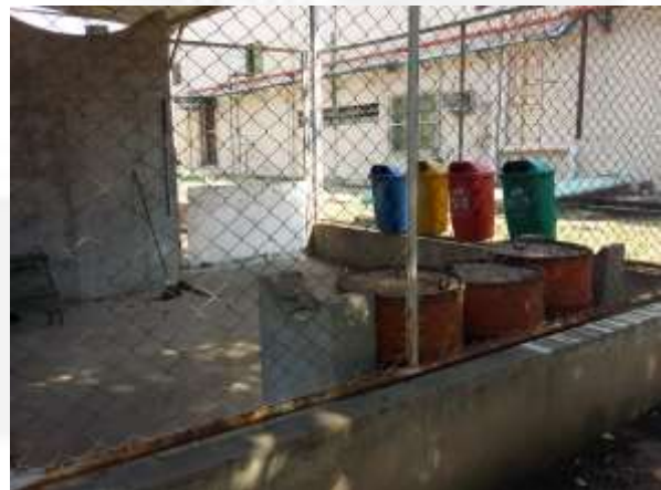
Foto 4 – Depósito de óleo usado