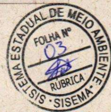
FOTO MEIO AMBIENTE 1