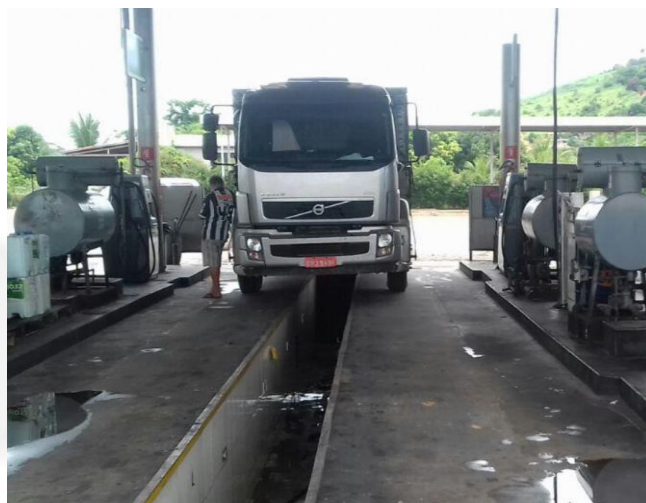
Foto 02 – Vala de troca de óleo dentro da pista de abastecimento.