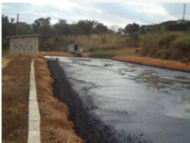
Foto 12. Antiga lagoa após o biodigestor.