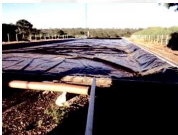
Foto 11. Biodigestor após manutenção.