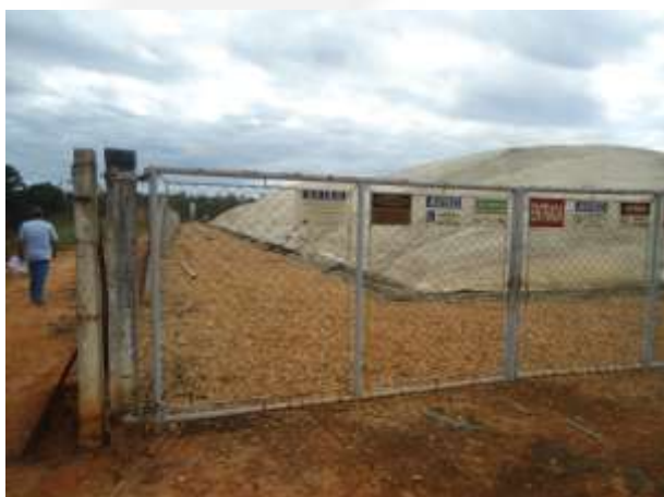
Foto 10. Biodigestor antes da manutenção.