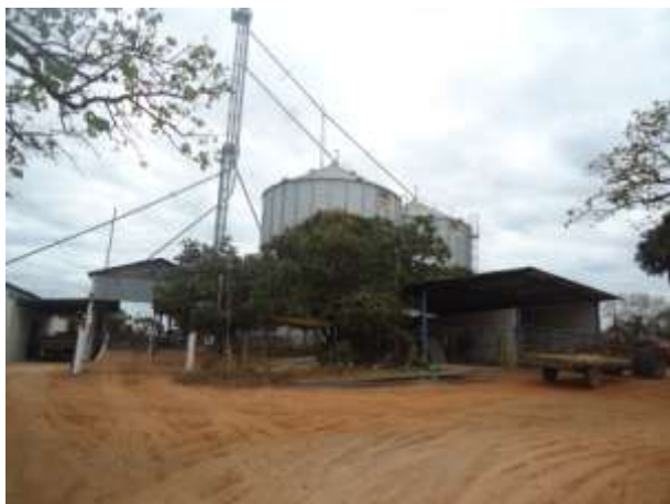
Foto 08. Vista da fábrica de rações com o conjunto silos metálicos.