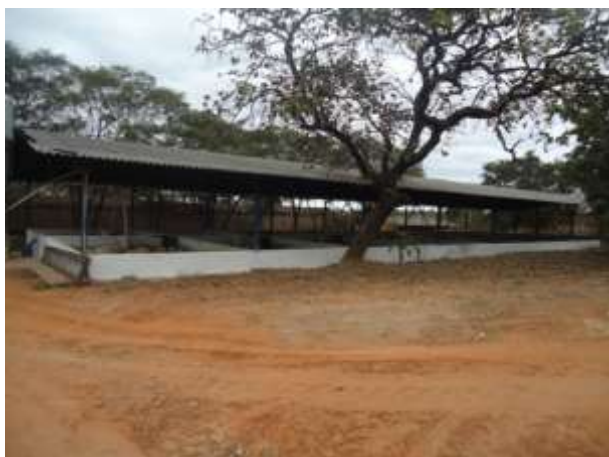
Foto 02. Vista lateral do galpão da suinocultura.