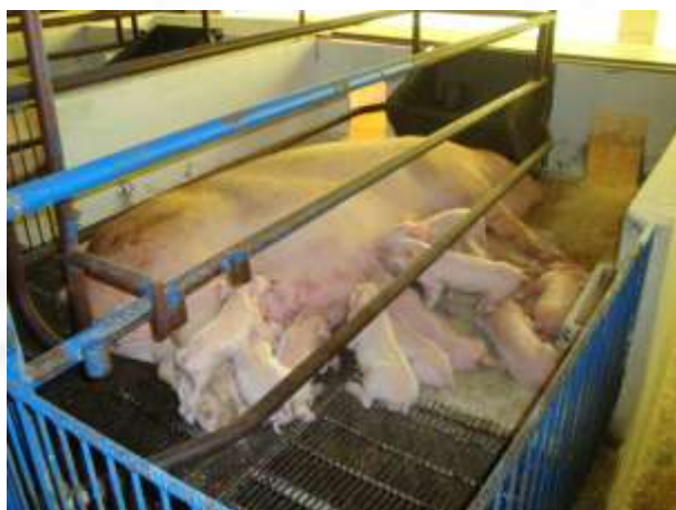
Foto 05. Vista de uma gaiola de maternidade