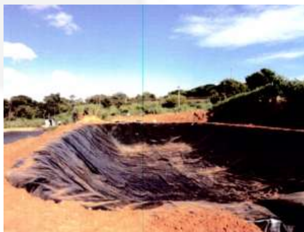
Foto 13. Lagoa construída após o biodigestor, à esquerda esta a antiga lagoa.