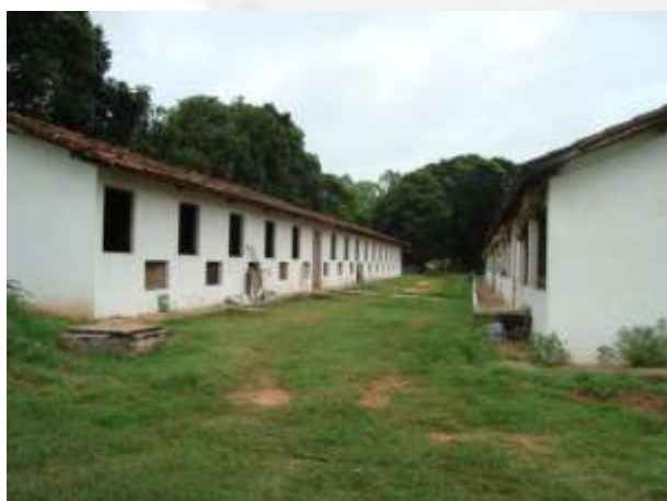
Foto 06. Vista externa de um galpão de creche a esquerda e outro de engorda à direita.