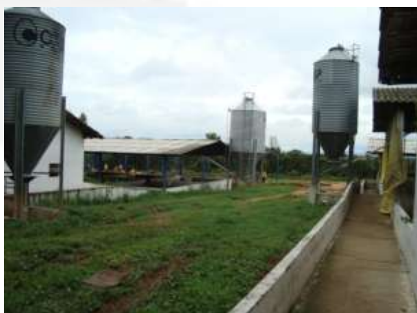
Foto 07. Vista interna da área da granja.