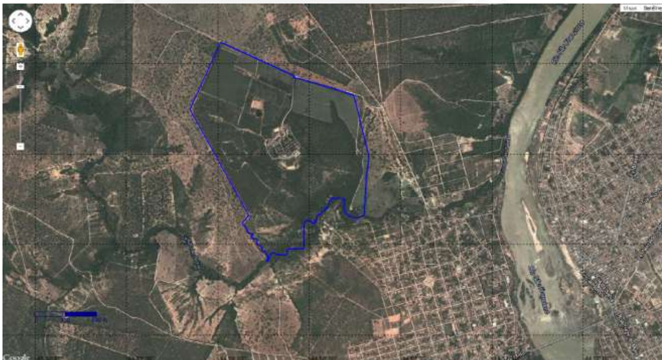
Foto 01- Localização do Empreendimento em relação às cidades de Buritizeiro e Pirapora.