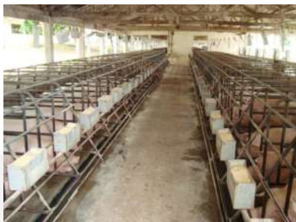
Foto 03. Vista de um galpão de gestação, corredor central.