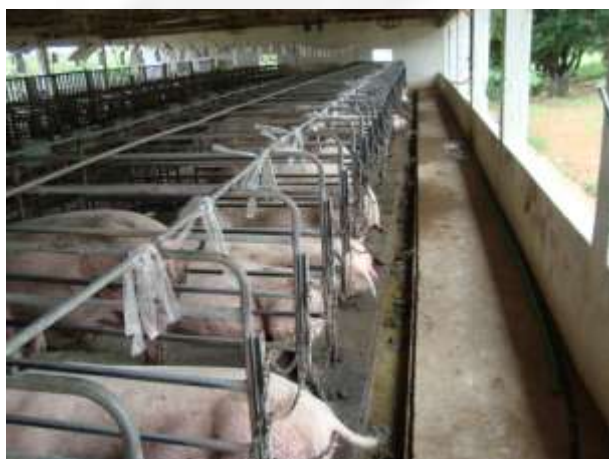
Foto 04. Vista da parte traseira de um conjunto de gaiolas de gestação