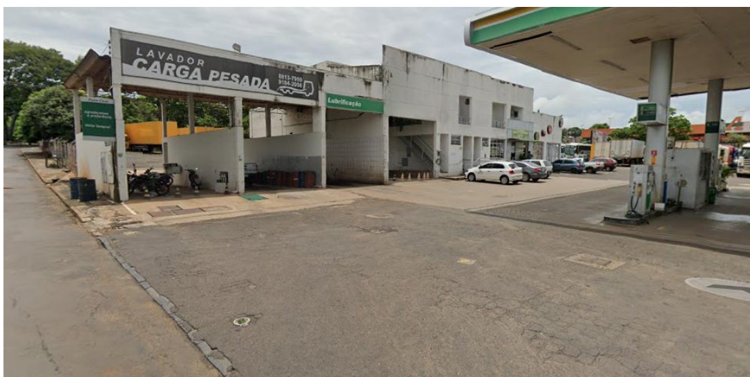
Vista lateral: lavador da pista inferior desativado