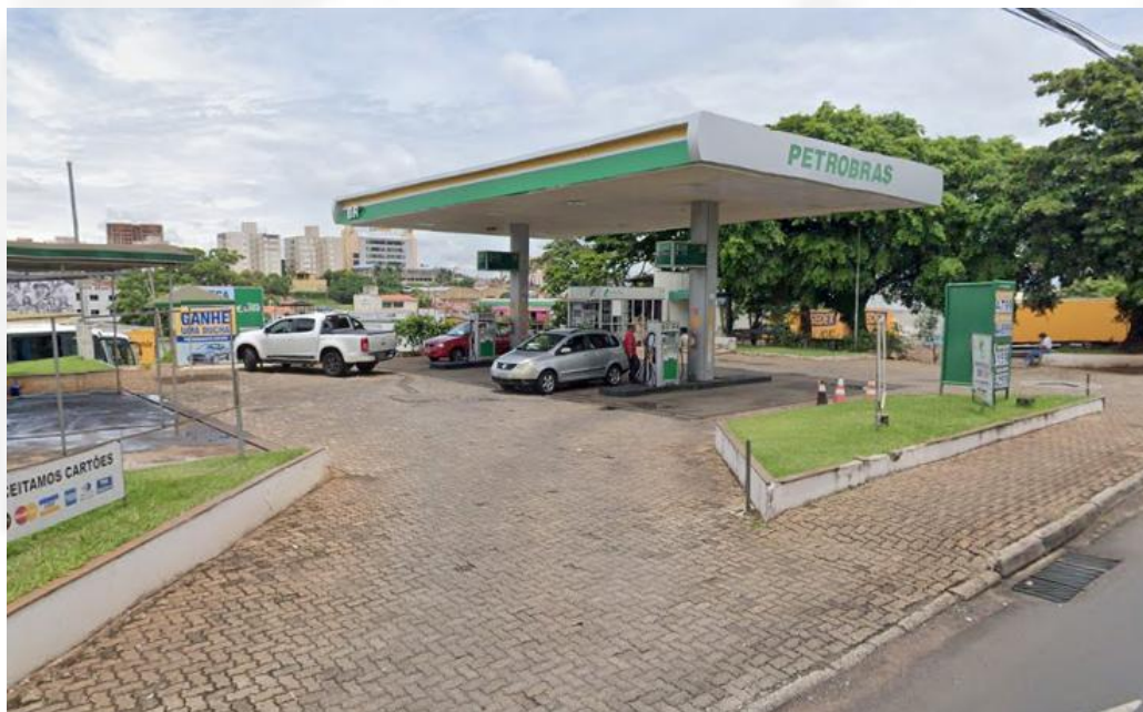
Vista da Pista 01