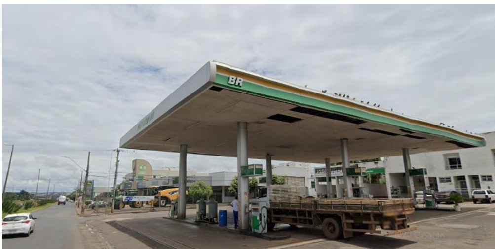
Vista da Pista 02

Ambas as pistas são construídas em concreto polido, com cobertura metálica e sistema de drenagem oleosa, com canaletas nas extremidades das pistas direcionadas à caixas separadoras de água e óleo; para o sistema de drenagem oleosa há duas caixas separadoras, ou seja, uma CSAO para cada pista.