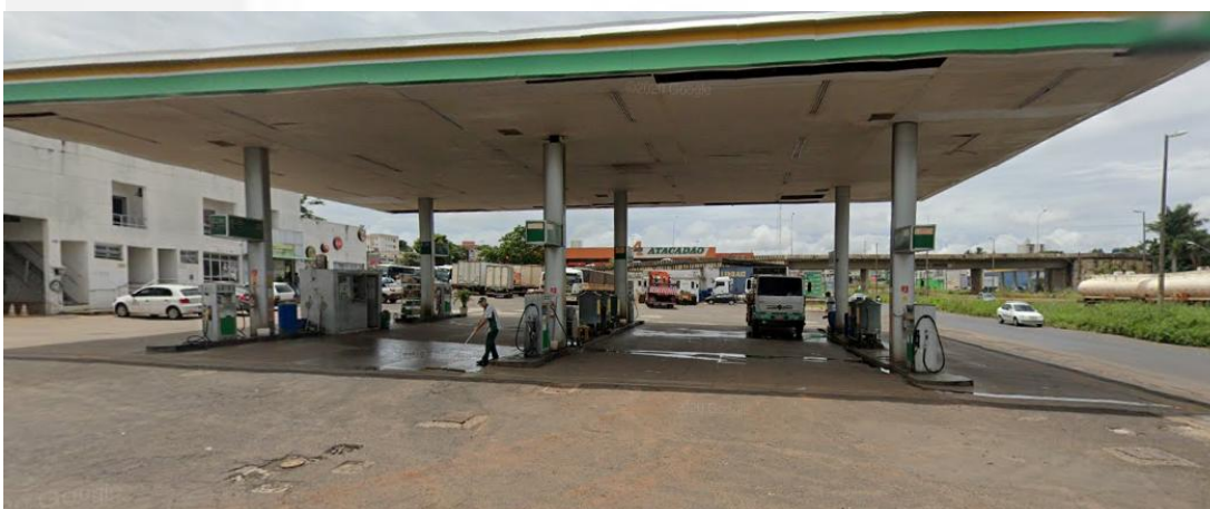
Área de abastecimento