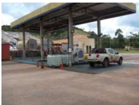
Foto 03: Pátio de abastecimento de veículos pequenos