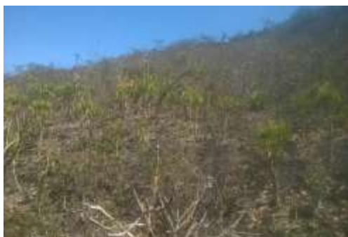
Foto 09: Vegetação a ser suprimida Área de Campo Rupestre Ferruginoso.