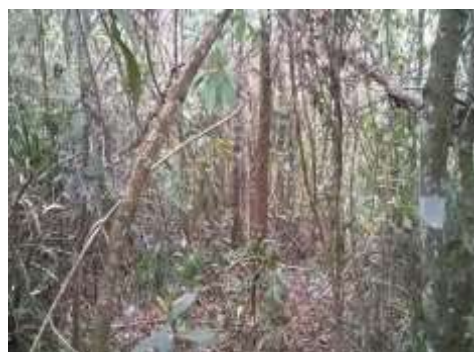
Foto 10: Vegetação a ser suprimida Floresta Estacional Semidecidual - Médio