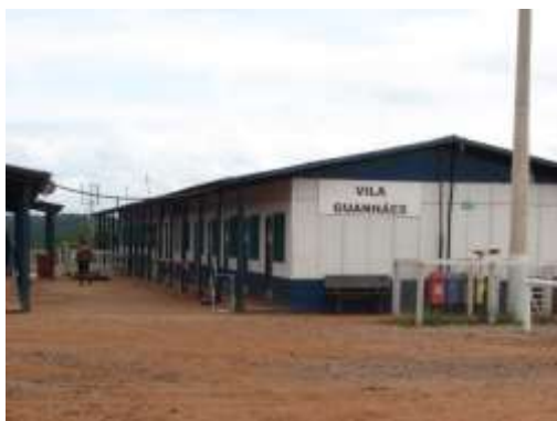
Foto 01: Alojamentos

Empreendedor: Anglo American Minério de Ferro Brasil S.A Empreendimento: Anglo American Minério de Ferro Brasil S.A CNPJ: 02.359.572/0003-59 Municípios: Conceição do Mato Dentro Atividade(s): Lavra a céu aberto com tratamento a úmido - minério de ferro Códigos DN 74/04: A-02-04-6 Processo: 00472/2007/008/2015 Validade: 06 anos